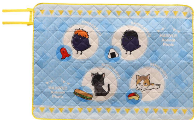
ラストゲット賞:ピクニックシート (全1種/約140×100cm)