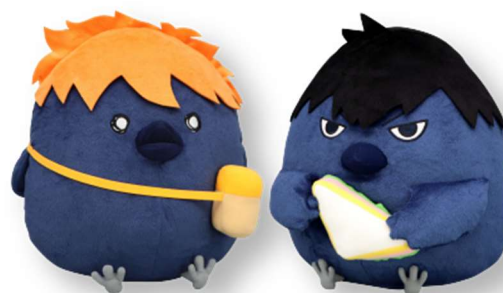
ダブルゲット賞:BIGぬいぐるみセット —ヒナガラス&カゲガラス— (全1種/約30×30cm、約28×30cm)