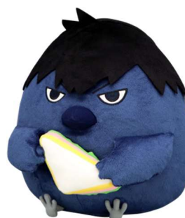
B賞: BIGぬいぐるみーカゲガラスー (全1種/約28×30cm)