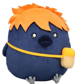
A賞: BIGぬいぐるみーヒナガラスー (全1種/約30×30cm)

<「みんなのくじ アニメ『ハイキュー!!』 アニマルピクニック」商品を一挙公開！>