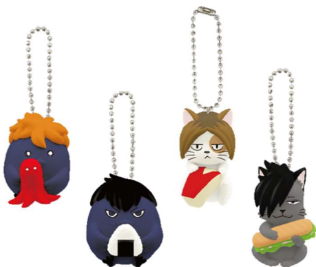
C賞:フィギュアセット (全 1 種 / 約 4~4.5cm)