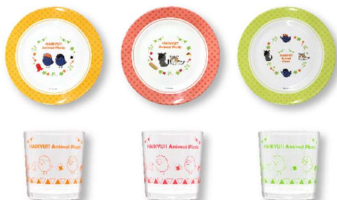
E賞:ピクニック カラー食器 (全 6 種 / プレート: 直径約 18cm、コップ: 約 7.5×9cm) ※いずれか 1 つになります。