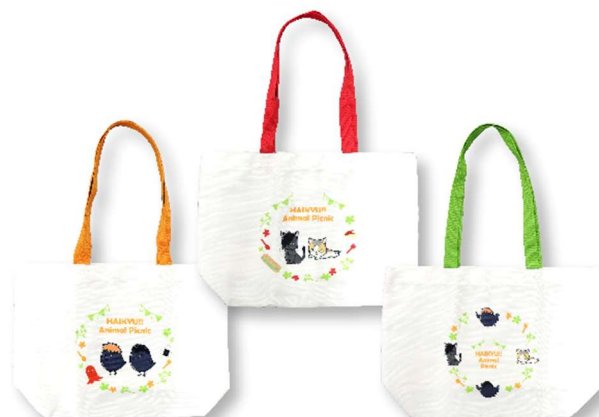
D賞:トートバッグ (全 3 種 / 約 45×30cm) ※いずれか 1 つになります。