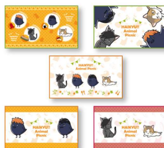
F賞:マルチクロス (全 5 種 / 約 44×25cm) ※いずれか 1 つになります。