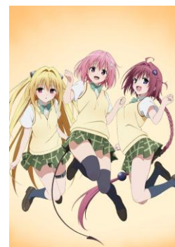
通常版パッケージイラスト