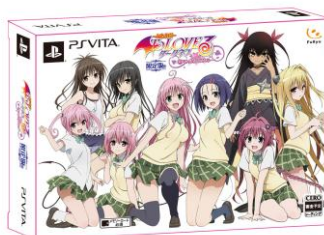
描き下ろし限定パッケージ