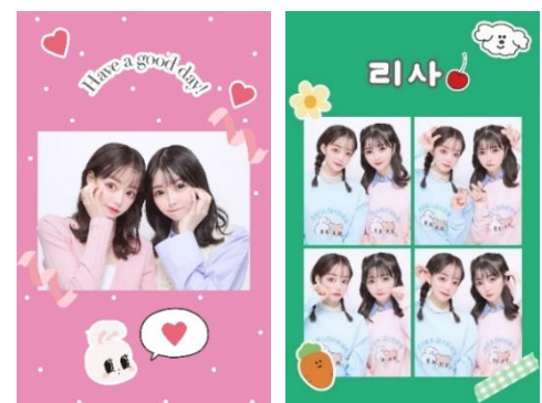
名前やスタンプを自由に配置し、オリジナリティ溢れる1枚にできる「デコシール」

「デコシール」では、シールに印刷する画像のレイアウト・色・柄・文字・スタンプが選べ、さらにその配置を自由にカスタイズすることが可能。従来機種では固定デザインの中から選択するのが主流でしたが、本機種ではシールのデザインを自分で考え作り上げる過程までもお楽しみいただけよう。 “推し”や自分の好きな世界観をイメージして作ったり、友達とお互いのシールを作りあったりと、楽しみ方は無限大です。