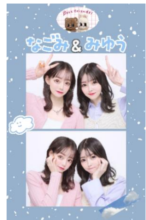
“自分が可愛いと思う1枚”にデザインでき、作る過程も楽しめる「デコシール」