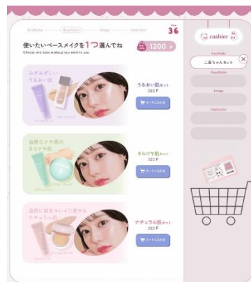
図1:メイクショッピング画面

『PURIMANIA』では、ユーザーが実際に買い物をしているような感覚で落書きアイテムを選択できる演出の搭載が求められました(図1)。従来システムではコンテンツの移動演出の開発は複雑なものでしたが、Unity標準機能「Rigidbody2D」と「BoxCollider2D」を使用することで、選択したアイテムをカートに詰め込んでいくという動作演出の実現が、従来よりも短時間で可能になりました。