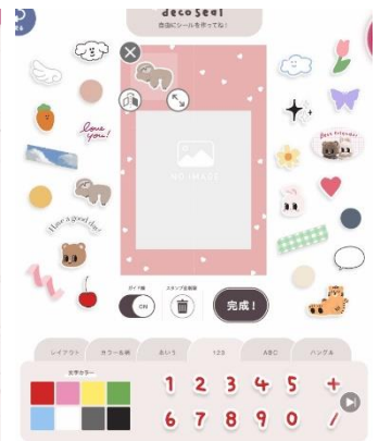
図2:シールオーダー画面