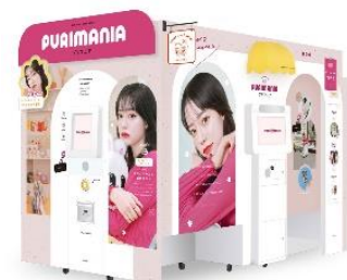
なごみさんがモデルを務める最新プリ機『PURIMANIA』。デザインも専門店をイメージ。