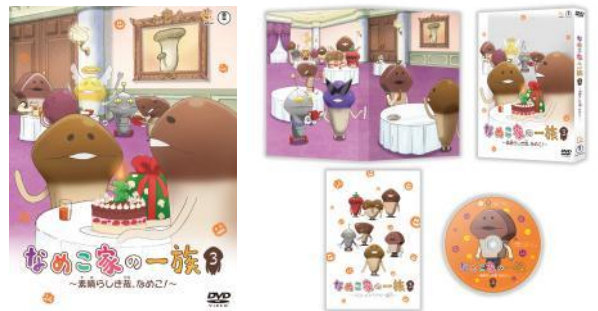
DVDジャケットイメージ