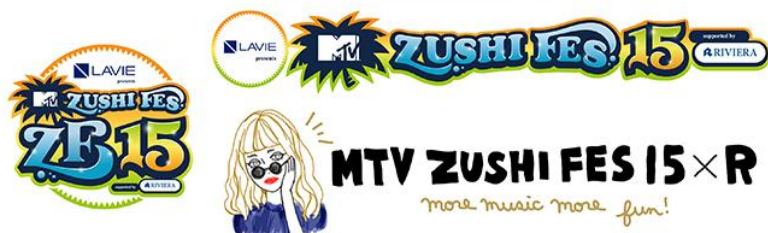
プリ機『R2』限定仕様 撮影背景・落書きスタンプ 例