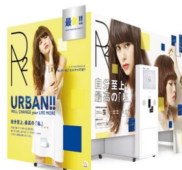
プリントシール機『R2』本体イメージ

▼『R2』詳細はこちらをご覧ください。 http://www.furyu.jp/2015/01/r2.html