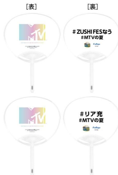
限定うちわ イメージ