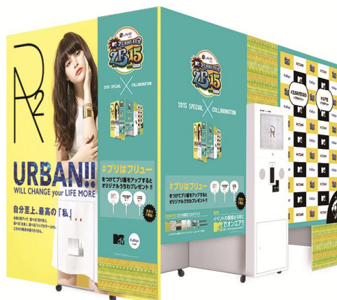
プリ機『R2』 限定仕様 外観イメージ

また、プリ機で撮影いただいた画像データをハッシュタグ「#プリはフリー」をつけて SNS(ソーシャル・ネットワーキング・サービス)にアップしていただいた方限定で、限定うちわをプレゼントいたします。