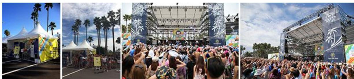
MTV ZUSHI FES 14 supported by RIVIERA

▼イベントに関する詳細は“LAVIE presents MTV ZUSHI FES 15 supported by RIVIERA”公式サイトへ http://zushifes.com/