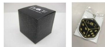
「Da-iCE」オリジナルBOX入り アクリルキーホルダー イメージ

http://www.amg.furyu.jp/allnews/press/20160516_collabomignon/