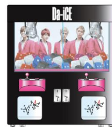
「WATCH OUT」装飾 クレーンゲーム機 イメージ

▼「collabo mignon(コラボミニョン)」第3弾:「Da-iCE(ダイス)」コラボレーションリリース初報についてはこちら