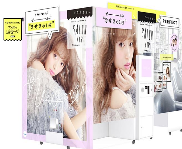
プリ機『SALON AIR』外観イメージ