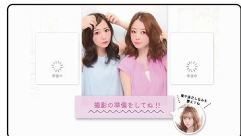
『SALON AIR』撮影画面イメージ

従来機に比べ次の撮影のシャッターが下りるまでの時間を長めに設定。髪を整えたり、ポーズや表情をつくる時間を確保しました。