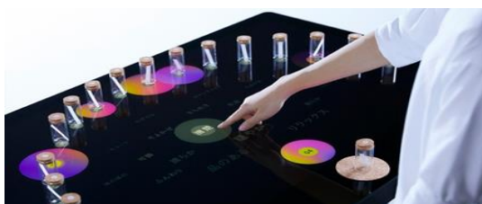
香りと言葉の変換システム「KAORIUM」のコンセプトモデル

(※1) 参照元:「注意が脳の嗅覚処理に及ぼす影響 —脳波計測により匂い呈示後 1 秒以内の脳活動の変化を検出—」 https://www.a.u-tokyo.ac.jp/topics/topics_20190322-1.html