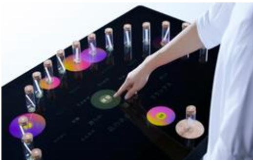
香りと言葉の変換システム「KAORIUM」のコンセプトモデル

(※1)参照元:「注意が脳での嗅覚処理に及ぼす影響 —脳波計測により匂い呈示後1秒以内の脳活動の変化を検出—」 https://www.a.u-tokyo.ac.jp/topics/topics_20190322-1.html