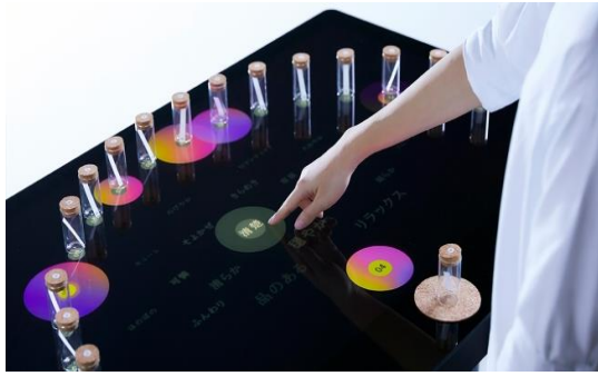
香りと言葉の変換システム「KAORIUM」のコンセプトモデル