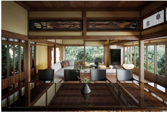
三面緑に囲まれたプライベートダイニング