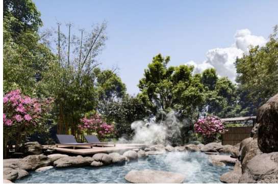
川のせせらぎが聞こえる開放的な露天風呂