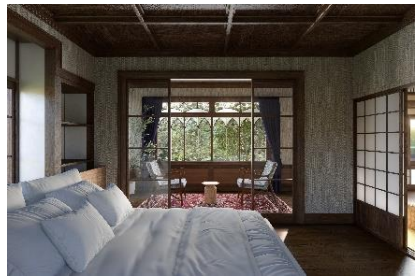
三つの寝室は独立した洗面と浴室を備えており、団らんとプライベートの両立を叶えます。