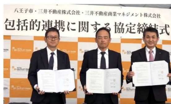
2026年3月8日「包括的連携に関する協定締結式」

また、当社は、2026年3月8日に八王子市および三井不動産商業マネジメント株式会社と相互の連携を強化し、地域社会の活性化および市民サービスの向上を図るための「包括的連携に関する協定書」を締結いたしました。八王子市をはじめ、駅周辺の商業施設、東京都、東京都立大学などとも連携を図りながら、南大沢エリア全体の持続的な発展を目指します。