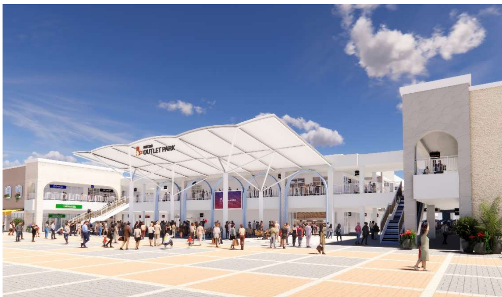
「三井アウトレットパーク 多摩南大沢 B 街区」 入口(大屋根広場) CG

本計画では、A 街区は営業を継続しながらリニューアル、B 街区は建替えを行い、東京都最大規模のアウトレットにスケールアップいたします。さらに、飲食機能や大屋根広場の整備によるイベント機能の強化等を行い、お買い物にとどまらない、多様な過ごし方を提供することで、さらなる賑わいをもたらす施設を目指してまいります。