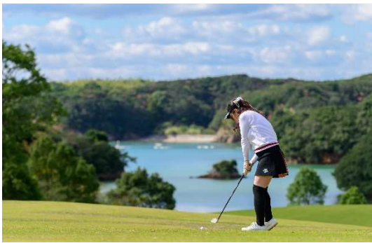
NEMU GOLF CLUB