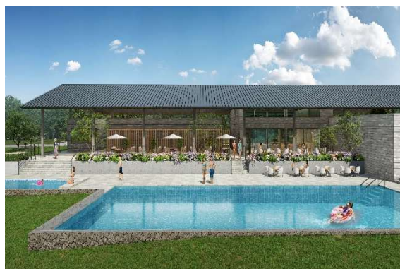
ヒルトップハウス メインプールイメージ