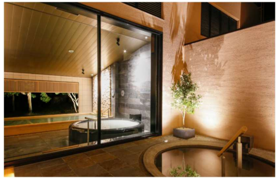
温泉を備えた温浴施設 恵みの湯