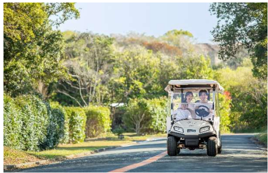
敷地内を周れるランドカー