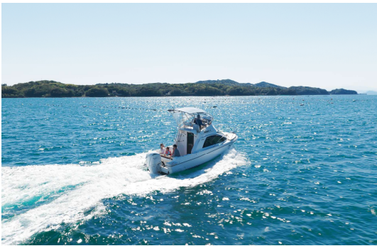
マリntaxシーを利用したチェックイン