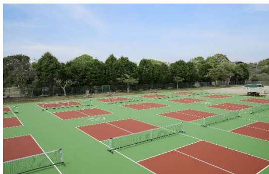
ピクセルボールコート

英虞湾の海と豊かな森を舞台に、時間帯を問わず様々な体験をお楽しみいただけます。家族や仲間と幅広い世代で楽しめるピクセルボールコートを 10 面新設。マリンアクティビティの出発点となるマリーナハウスもリニューアルし、アクティビティ前後にゆっくりおくつろぎいただけます。マリーナから出航するマリンタクシーによる海上移動や英虞湾を巡るクルーズで、海を間近に感じる時間もご提供します。