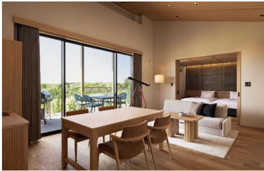
ヒルズヴィラ内観

伊勢志摩の自然を最大限に体感できる客室として、ヒルズヴィラ 8 棟・フォレストヴィラ 10 棟を新設いたします。新設するヴィラは 81 ㎡(ウッドデッキ含む)を基準タイプとし、フォレストヴィラのうち 2 棟はファミリーやグループに最適な 2 ベッドルーム(118 ㎡、ウッドデッキ含む)になります。三重県産の木材も使用したヴィラでは、豊かな自然に包まれた、静かなひとときをお過ごしいただけます。また、ビューバスやテラスを設け、テラスでは三重県産の食材をメインとしたバーベキューをお楽しみいただけるほか、お部屋には天体望遠鏡やレコードプレーヤーを備え、伊勢志摩の美しい星空観察や音楽とともに過ごす時間をご提供いたします。さらに、複数泊での滞在にも対応できるよう、洗濯乾燥機や大型冷蔵庫も設置いたしました。既存のフォレストヴィラ 8 棟は全て愛犬(一部大型犬を含む)と一緒にご宿泊いただける「フォレストヴィラ DOG」へと生まれ変わります。各棟へは乗用車の乗り入れもでき、各棟専用のカートで、広大な NEMU RESORT の敷地内を快適にご移動いただけます。