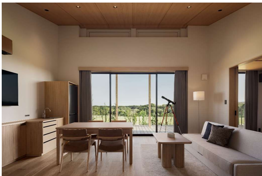
ヒルズヴィラ内観

今回のリニューアルでは18棟の新ヴィラが誕生し、ダイニングや館内施設も大幅に刷新。さらに2026年7月18日(土)には、大自然を望む絶景プールを擁する「ヒルトップハウス」が開業予定です。伊勢志摩を代表するデスティネーションリゾートとして、四季を通じてお楽しみいただける様々な体験を提供してまいります。