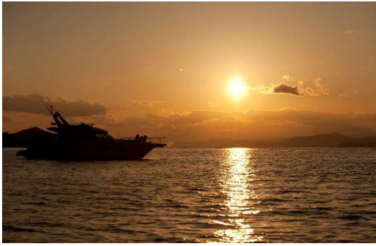
サンセットクルージング