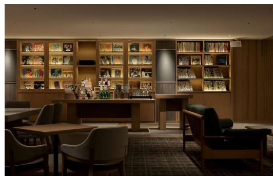
ザ・ロビーラウンジ