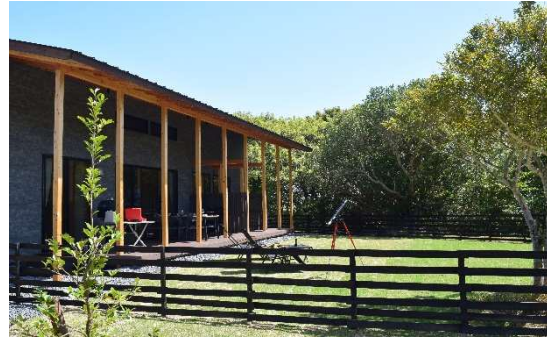
フォレストヴィラ外観