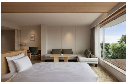
エグゼクティブ客室

新たに設置するキッズスペースでは、伊勢志摩や NEMU RESORT の自然をテーマとした空間とし、小さなお子さまが安心して学び、楽しめる環境を整えています。