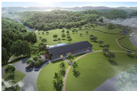
ヒルトップハウス 外観イメージ

NEMU RESORT 内の「てふてふの丘」に、大自然を一望できる「ヒルトップハウス」が2026年7月18日(土)に開業いたします。メインプール・ジェットバス・キッズプールを備えたプールエリアに加え、新設する「ダイニング里山」は、大自然を望む空間としてプール営業日や団体パーティーにご利用いただけます。