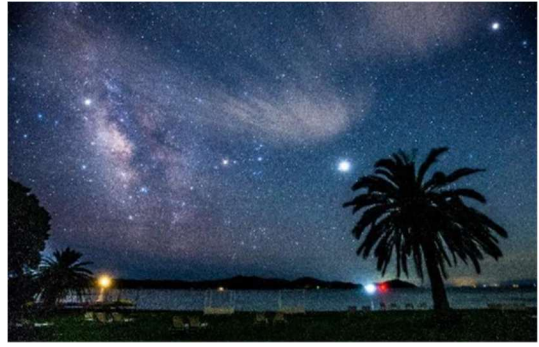
敷地内から見える星空