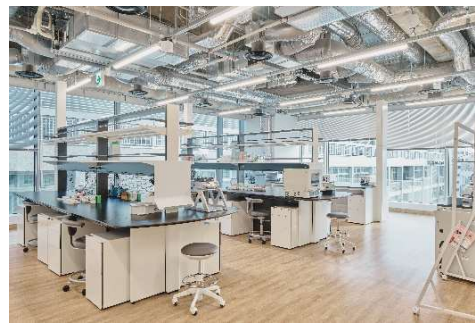
SS-F Lighthouse Lab 専有部