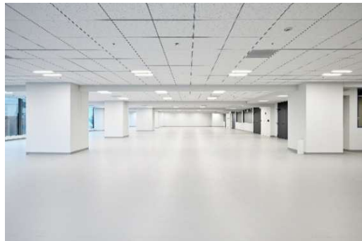
三井リンクラボ横浜関内 ラボ専有部

(※2) BSL(biosafety level)とは、細菌、ウイルスなどの微生物、病原体等を取り扱う実験室、施設の格付け。BSL2は、疾患を起こす可能性があるが重大な災害となる可能性のない病原体。