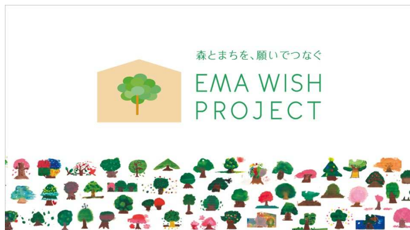
「EMA WISH PROJECT ～森とまちを願いでつなぐ～」キービジュアル

https://www.mitsuifudosan.co.jp/business/development/earth/mokuzai/emawishproject/