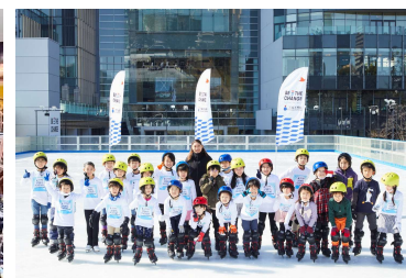
三井不動産スポーツアカデミー (アイススケートアカデミー)