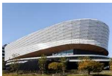
LaLa arena TOKYO-BAY (千葉県船橋市)

また、東京ドームなどで開催される大型アーティストライブと連動した公式 POP-UP イベントが行われる「MIYASHITA PARK」、本格的なスポーツ・エンターテインメントイベントが実施可能な屋内型スタジアムコート有する「三井ショッピングパーク ららぽーと堺」「三井ショッピングパーク ららぽーと安城」、スポーツや映画・音楽コンサートなどのパブリックビューイングが開催できるスポーツパーク有する「三井ショッピングパーク ららぽーと福岡」などのスポーツ・エンターテインメントの要素を盛り込んだ街づくりも手掛けています。