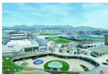
三井ショッピングパーク ららぽーと福岡 (福岡県福岡市)