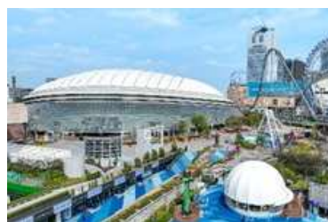
東京ドームシティ (東京都文京区)