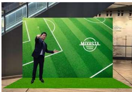
※最終確定前につき画像はイメージです