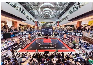
三井ショッピングパーク ららぽーと堺 (大阪府堺市)