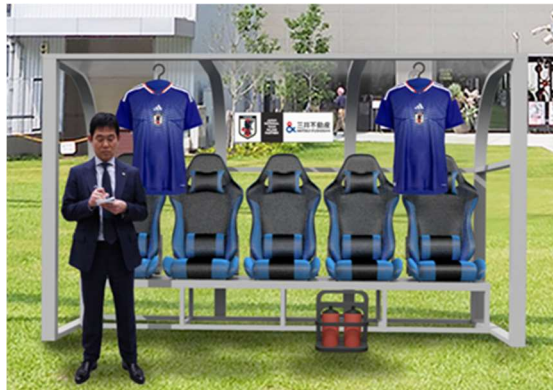
※最終確定前につき画像はイメージです