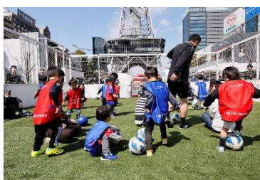
三井不動産フットボールスクエア (価値共創活動)