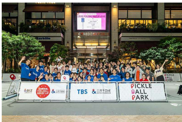
テナント企業向け参加型イベント「&BIZ event」 企業対抗ピククルボール大会「&BIZ CUP」開催の様子

三井のオフィスでは、&BIZを通じてワーカーの毎日をより豊かにし、テナント企業のパフォーマンスの最大化につながるサービス提供に取り組んでいます。