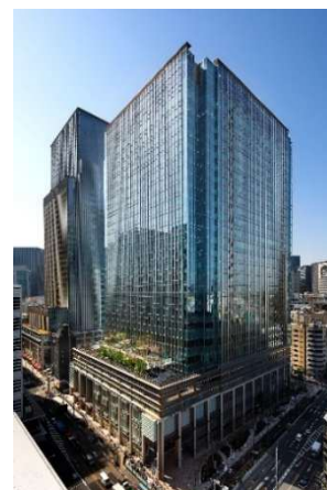
日本橋室町三井タワー