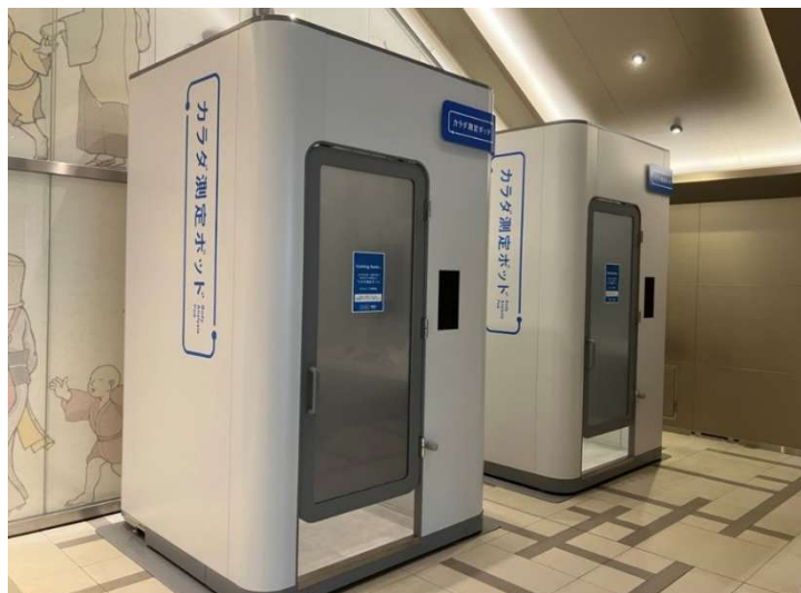
「カラダ測定ポッド」設置の様子(日本橋室町三井タワーB1階)

企業における健康経営や人的資本への関心の高まりを背景に、従業員のウェルビーイング向上に資する取り組みの重要性が増している中、今回の設置は、日本橋室町三井タワーおよび周辺オフィスに勤務するオフィスワーカーを主な対象とし、日常の中で健康状態を可視化できる環境を提供し、新しい健康習慣の創出を目指すものです。三井不動産は、オフィスワーカー向けサービス「&BIZ(アンドビズ)」の一環として、テナント企業の従業員の健康増進やウェルビーイング向上に資する取り組みとして本サービスを展開します。なお、本サービスは来街者にもご利用いただける環境とすることで、街全体への波及と新たなヘルスケア体験の定着を目指してまいります。