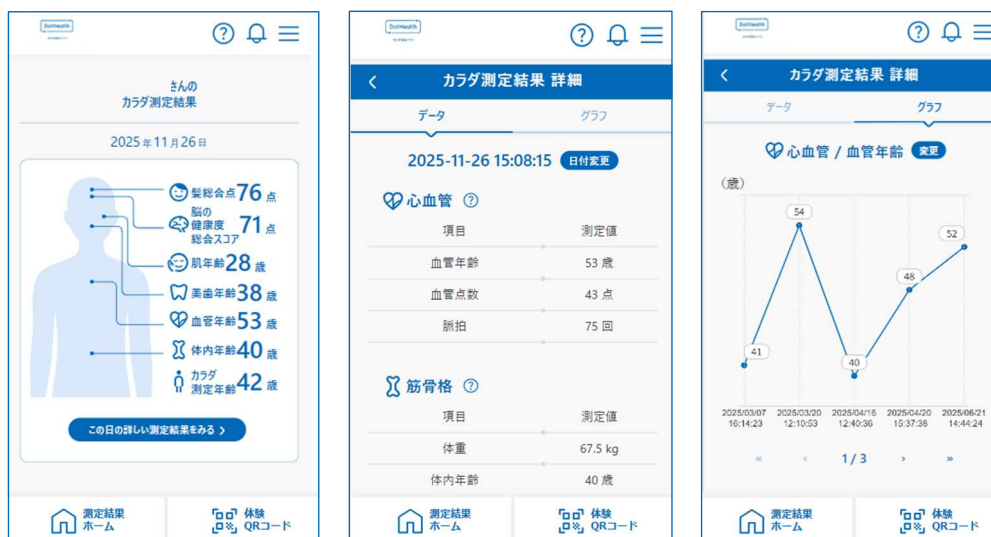
カラダ測定サービスに関するアプリケーションのイメージ

本サービスにおいては、継続的な利用によりユーザーの健康に関する意識変容・行動変容へつなげるとともに、日常生活における持続的な健康支援を実現します。オフィスワーカーが昼休みや業務の合間に利用し、日々の体調変化の把握や、結果の共有を通じた健康意識の醸成など、日常の中で継続的に活用されることを想定しています。また、コンディション管理を通じて生産性向上に資する活用も期待されます。