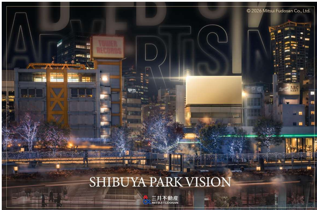
三井不動産が手掛ける、新たなランドマークメディア。1号案件は「SHIBUYA PARK VISION」

日本の総広告費は約8兆円と5年連続で成長を続け、「屋外広告」や「イベント・展示・映像」などのプロモーションメディア広告費も伸長しています。DOOH(デジタル屋外広告)や店舗内サイネージなどのいわゆるリテールメディアも活発になってきている市場環境のなか、当社が得意とする「リアル」な体験価値の提供を生かした広告市場への挑戦となります。