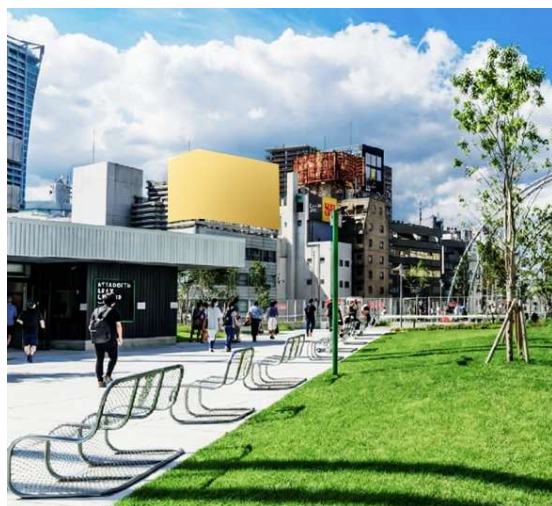
L 字型形状を生かした 3D 演出。 2D の CM 動画流用も可能

「SHIBUYA PARK VISION」は、当社が手掛ける商業施設「MIYASHITA PARK」からもダイレクトに視認できるポジション(渋谷市野ビル屋上)に新たに開発・設置いたします。渋谷駅出口から徒歩 3 分、月間約 170 万人※を超える来場者を集める渋谷有数の人気施設、好立地での広告プロモーションが可能となりました。公園の芝生ひろばのイベントスペースと一体となった演出や、周辺媒体と合わせた広告展開など、広告主様のプロモーションの幅を広げる渋谷の新たなランドマークメディアとして提供してまいります。(※FRAYARD MIYASHITA PARK 開業時調査報告書)(2020より)