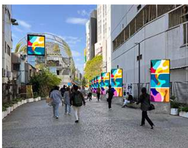
MIYASHITA PARK 館内外 58 面ビジョンで渋谷をジャック