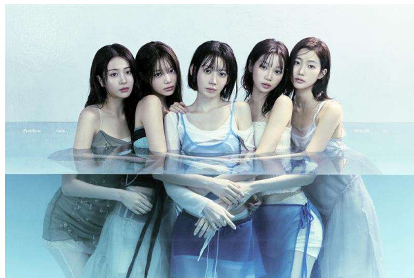
(P)&(C) SOURCE MUSIC

「SHIBUYA PARK VISION」の初回放映として、「LE SSERAFIM」の新曲「BOOMPALA」のプロモーションが決定しました。本ビジョンの 3D 形状を生かした立体的な映像演出を展開し、6 月 1 日より放映を開始します(5 月 23 日よりテスト放映予定)。