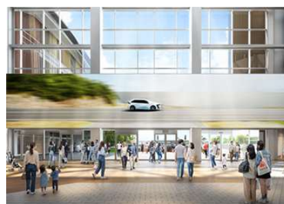
アーバンドック ららぽーと豊洲 ファミリー層に人気の全国展開施設

これまで当社グループでは、当社グループが管理運営する商業施設やオフィス複合施設にて、イベントスペースを中心に屋内外の広告媒体を提供してまいりました。今後、今回の新たな取り組みのように、当社管理物件以外での屋外広告開発から、グループアセットも横断的に活用したご提案まで、プロモーション活動の支援を広げてまいります。