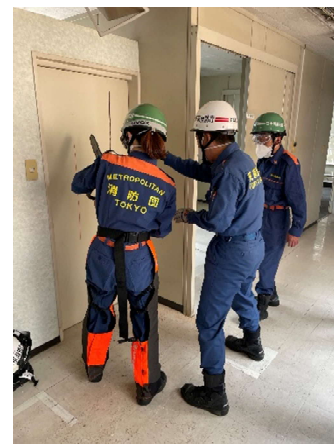
消防団による扉破壊訓練