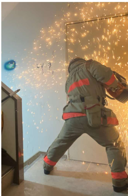
エンジンカッターでの扉破壊訓練

三井不動産は今後も、安心安全で災害に強いまちづくりの実現に向けて、関係機関や地域の皆様と連携し、地域防災力の向上に貢献してまいります。