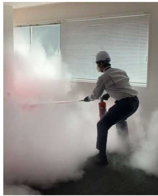
管理スタッフによる粉末消火器放出