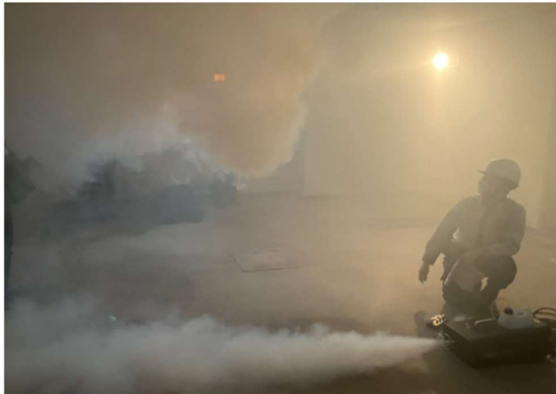
管理スタッフによる煙体験訓練

消防署・消防団は、稼働中のビルでは実施が難しいエンジンカッター等を用いた扉破壊訓練を実施しました。また、管理スタッフは、扉破壊訓練、粉末消火器放出訓練、煙体験を通じて、災害発生時の初動対応力向上を図りました。