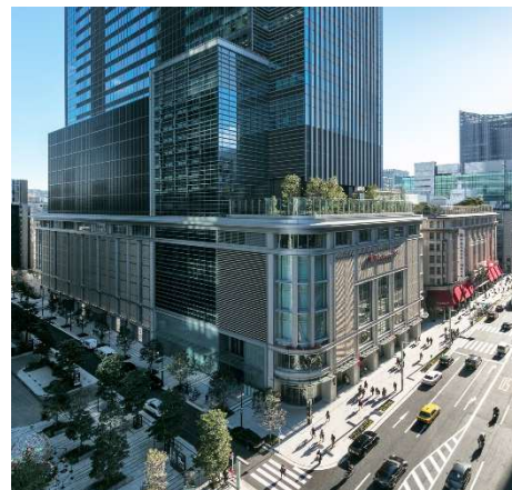
日本橋高島屋三井ビルディング