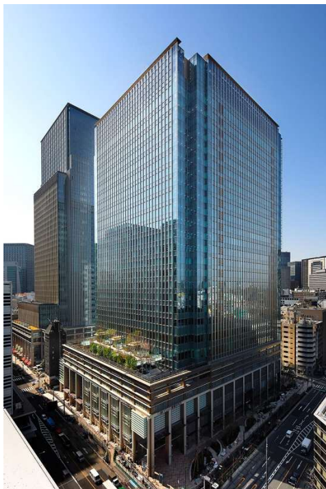
日本橋室町三井タワー

今後もサステナブルファイナンスに積極的に取り組むことにより、資金調達の多様化と持続可能な社会の実現に貢献してまいります。