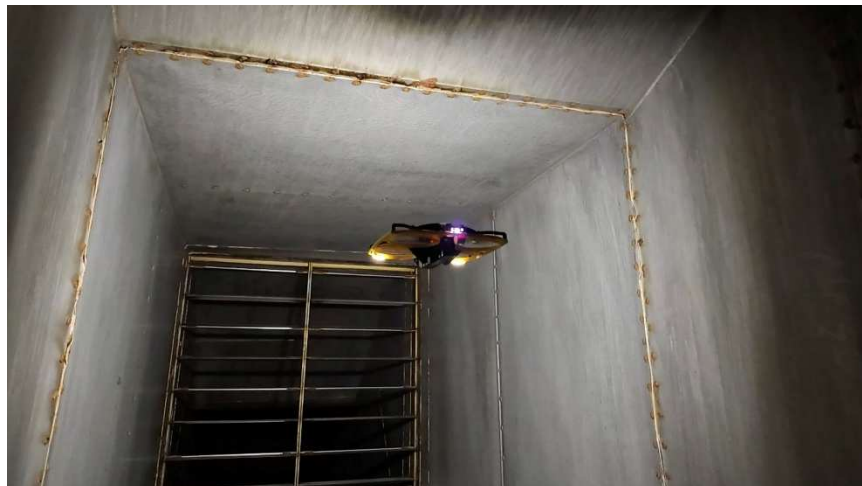
ダクト内部を飛行する様子

IBIS2 による狭小空間点検実証の動画 URL : https://youtu.be/v35GlgUqPUU