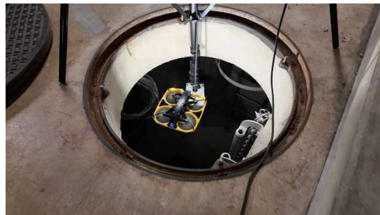
＜マンホールに入る様子＞