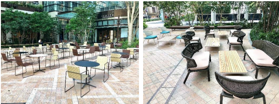
COREDO 室町テラス 大屋根広場