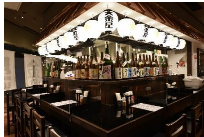
大金星 (COREDO 室町テラス)