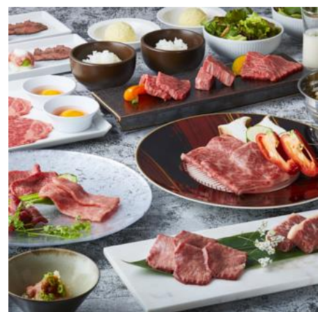
「東京焼肉一頭や」の肉コース(イメージ)