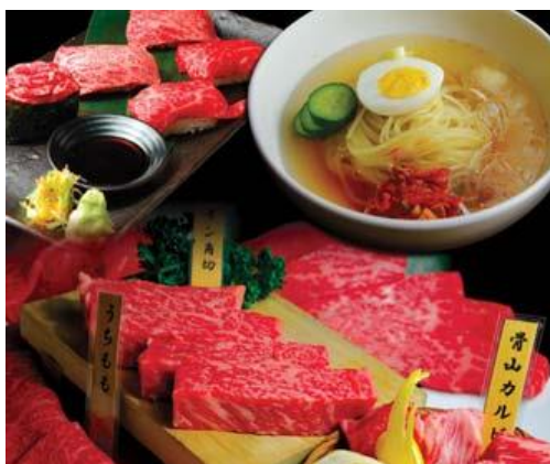
「和牛一頭焼肉 盛岡手打冷麺 房家」の焼き肉コース(イメージ)

※2021年7月31日までに「オフピークプラン」にお申込みいただいたお客さまは初月分の月額利用料が無料。