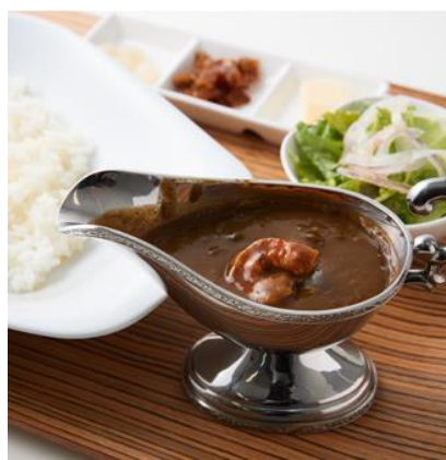
「欧風カレー ガヴィアル」のカレー