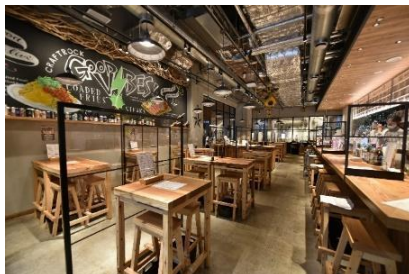
CRAFTROCK BREWPUB & LIVE (COREDO 室町テラス)