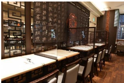
四川飯店 日本橋 ～Chen Kenichi's China～ (COREDO 室町 1)