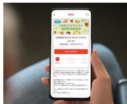
「COREDO サブスク」の利用画面