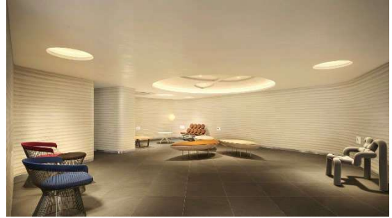
エントランスホール 完成イメージ