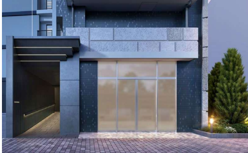
エントランス 完成イメージ

本物件は、JR 中央・総武線「船橋」駅徒歩 4 分、京成本線「京成船橋」駅徒歩 2 分に位置し、住みたい街ランキング千葉県で 1 位※ 1 、先進と趣きが重なり合う、千葉県有数の商業集積地である「船橋」の中心地に誕生します。徒歩 5 分圏内に便利な生活環境が広がる「船橋」駅は、「東京」駅まで 26 分、「新橋」駅まで 30 分、「品川」駅まで 35 分と、都内主要エリアにいずれも乗り換えなくアクセス可能です。三井不動産グループによる開発が進む「南船橋」エリアへもバスや自転車で快適にアクセス可能となります。