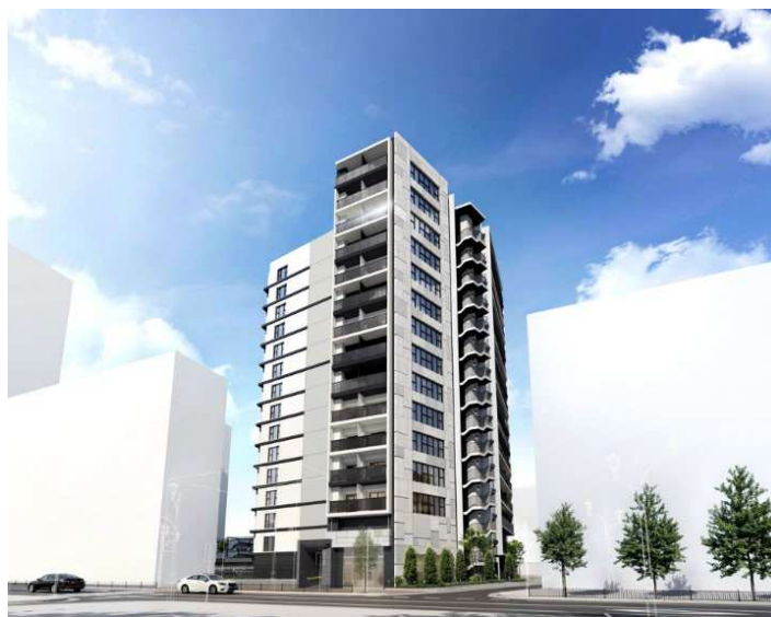
パークホームズ船橋 外観完成イメージ

今後も、三井不動産レジデンシャルの全住宅事業のブランドコンセプトである「Life-styling × 経年優化」のもと、多様化するライフスタイルに応える商品・サービスを提供するとともに、安全・安心で快適にくらせる街づくりを推進し、持続可能な社会の実現・SDGsへ貢献してまいります。