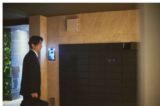
共用部顔認証イメージ(宅配ボックス)