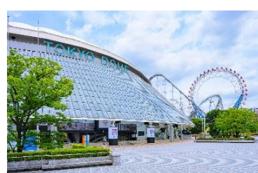
東京ドームシティ （東京都文京区）