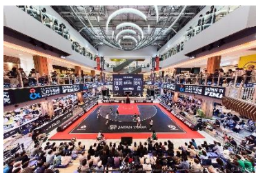
三井ショッピングパーク ららぽーと堺（大阪府堺市）

また、東京ドームなどで開催される大型アーティストライブと連動した公式 POP-UP イベントが行われる「MIYASHITA PARK」、本格的なスポーツ・エンターテインメントイベントが実施可能な屋内型スタジアムコート有する「三井ショッピングパーク ららぽーと堺」「三井ショッピングパーク ららぽーと安城」、スポーツや映画・音楽コンサートなどのパブリックビューイングが開催できるスポーツパーク有する「三井ショッピングパーク ららぽーと福岡」などのスポーツ・エンターテインメントの要素を盛り込んだ街づくりも手掛けています。