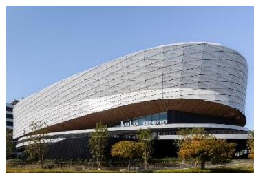
LaLa arena TOKYO-BAY （千葉県船橋市）