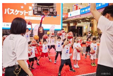
三井不動産スポーツアカデミー （バスケットボールアカデミー）