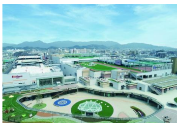
三井ショッピングパーク ららぽーと福岡（福岡県福岡市）