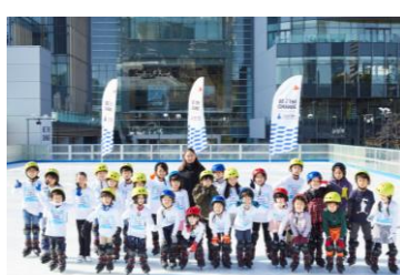
三井不動産スポーツアカデミー （アイススケートアカデミー）