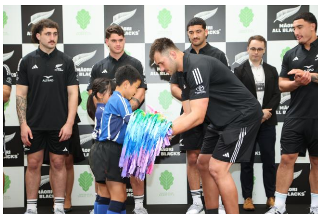
<地域の子どもたちとマオリ・オールブラックス選手の交流の様子>