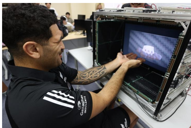
<研究室でプログラムを体験している選手の様子>