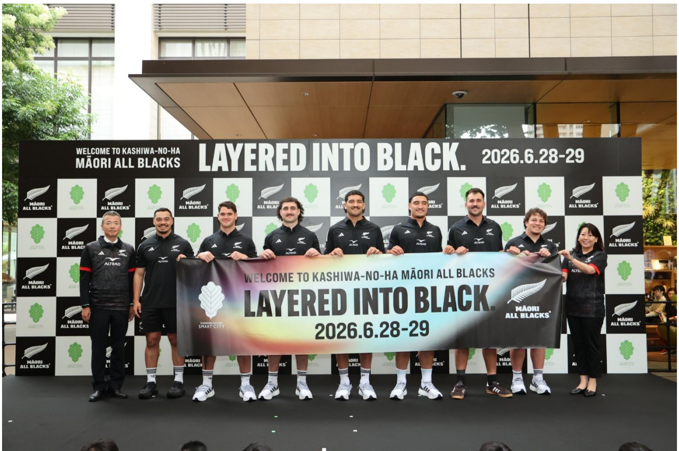
< ウェルカムセレモニーの様子 >

柏の葉スマートシティが目指す街づくりの原動力は「共創」です。これは、仲間との信頼、チームワーク、そして文化やコミュニティとのつながりを大切にする「マオリ・オールブラックス」の姿勢と深く共鳴しています。今回、世界トップレベルの選手たちと地域の人々が交わる機会を創出し、柏の葉スマートシティに新たな活気と一体感を生み出すことで、さらなる「革新（イノベーション）」が起こる街を目指し、今回の交流プログラムの開催へと至りました。