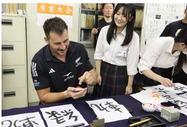
< 書道を体験するマオリ・オールブラックスの選手 >