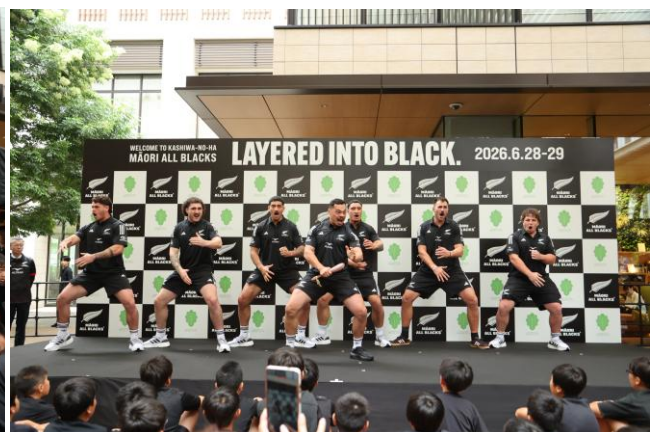
<マオリ・オールブラックス選手による「ハカ」>