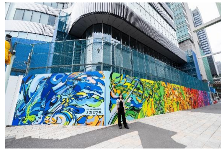
日本橋一丁目中地区市街地再開発事業（2025年7月～2026年1月） ナカミツキ『Nihonbashi Symphonia ー響きあう多声的な都市像ー』2025