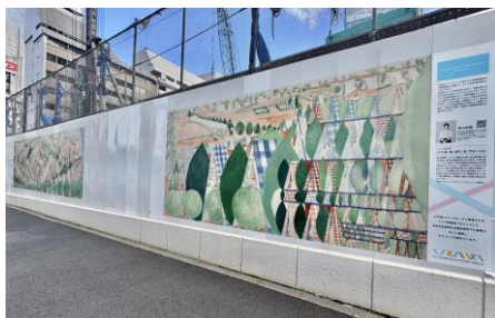
八重洲一丁目北地区市街地再開発事業（2025年10月～2026年3月） 東山詩織『4つの風景（万年青、橋、城門、家・門をくぐる）』2025