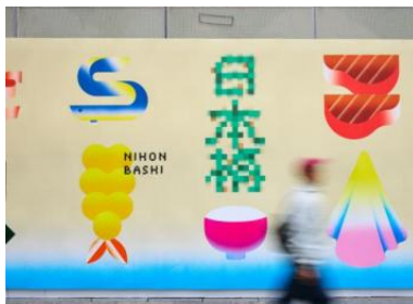
日本橋室町一丁目地区第一種市街地再開発事業（2025年12月～2026年11月（予定）） 木住野彰悟『Bridging Tradition and the Future』2025