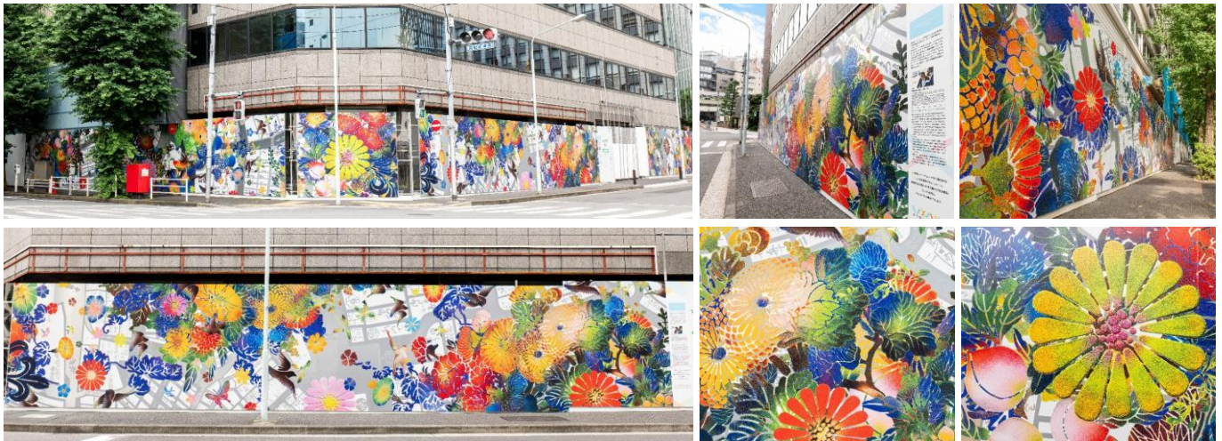
「日本橋一丁目1・2番地区第一種市街地再開発事業」の工事中仮囲い装飾

※1：日本橋リバーウォークとは、親水空間と川沿い歩行者ネットワークを中心に、5つの再開発区域とその周辺一帯を指すエリア名称です。