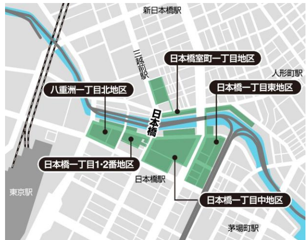
5つの再開発エリア

プレスリリース： https://www.nihonbashiriverwalk.jp/wp-content/uploads/release_20250611.pdf