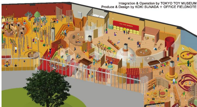
福岡おもちゃ美術館 イメージ図

アナログのおもちゃが約8,000点展示される体験型ミュージアムで、グッド・トイ受賞作や木育おもちゃ、大人が楽しめるボードゲーム、福岡の伝統玩具などで実際に遊ぶことができます。福岡県産の木がふんだんに使われた館内には、全国のおもちゃ作家の作品が並ぶミュージアムショップや日本を代表する家具産地である大川エリアの職人とコラボレーションしたギャラリーも併設されます。遊びの案内人として館内で活躍するボランティアスタッフ「おもちゃ学芸員」を養成し、開館までに約200名が誕生予定です。多世代が交流する日本最大級のおもちゃ美術館として、九州初進出となります。