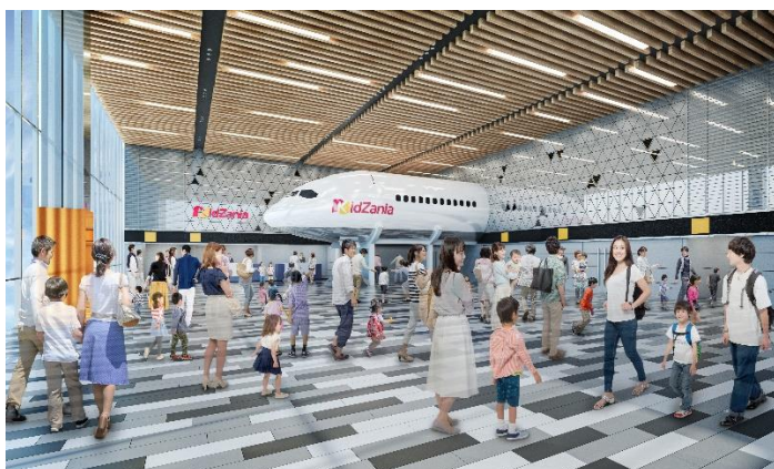
キッズニア福岡 イメージパース

「キッズニア」は、3歳から15歳までの子ども達を対象にした職業・社会体験施設です。現実社会の約2/3サイズの街並みに、実在する企業が出展するパビリオンが建ち並び、約100種類の仕事やサービスを体験できます。キッズニアのコンセプトは、「エデュケーション(学び)」と「エンターテインメント(楽しさ)」を合わせた『エデュテインメント』。子ども達が好きな仕事にチャレンジし、楽しみながら社会のしくみを学ぶことができる「子どもが主役の街」です。「キッズニア東京」(2006年開業)、「キッズニア甲子園」(2009年開業)に続き、九州初進出となり、開業は2022年夏を予定しています。