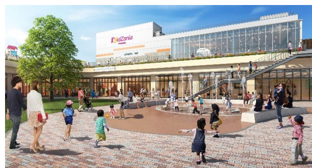
ららぽーと福岡 建物イメージ