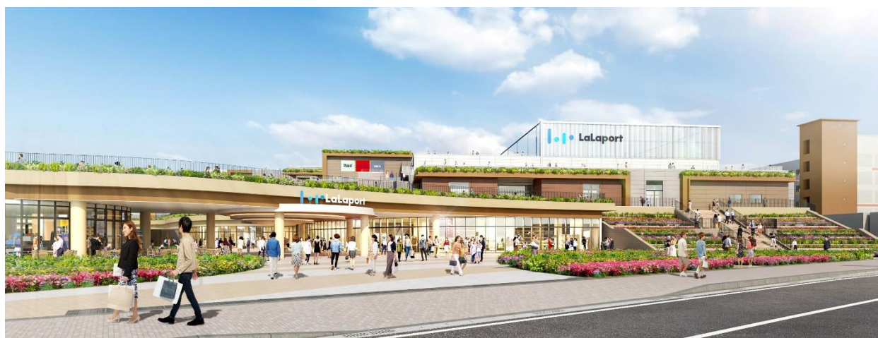
ららぽーと福岡 外観イメージ

多様な人々が集い出会う多彩な“パーク”（広場）をはじめとして、コミュニティの拠点となる活気あふれる空間を施設全体に創出し、福岡市における新たな拠点として、魅力的なまちづくりに貢献してまいります。具体的なパークの計画や導入コンテンツ等については、今後順次公表してまいります。