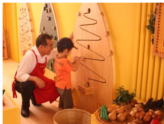
福岡おもちゃ美術館 イメージ写真