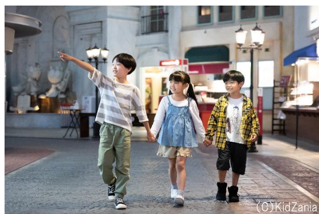
キッズニア福岡 イメージ写真