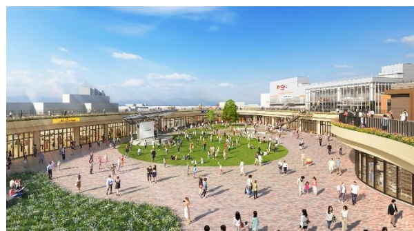
ららぽーと福岡 広場イメージ