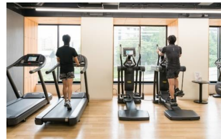
フィットネスなどパブリックスペースの人数制限と消毒の徹底