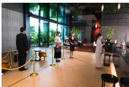
フィジカルディスタンスの確保