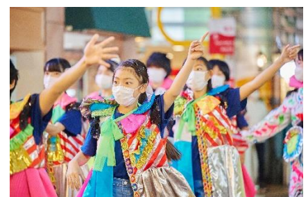
アニバーサリーパレード