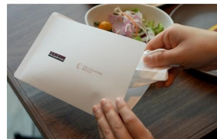
レストラン店内ではマスクケースをご用意