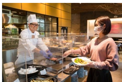
レストラン店内のアクリルボード設置とマスク・手袋着用徹底(ビュッフェ)