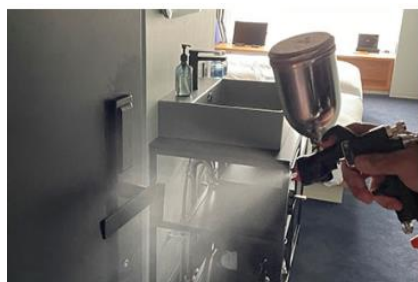
客室内の消毒と抗菌対策の徹底