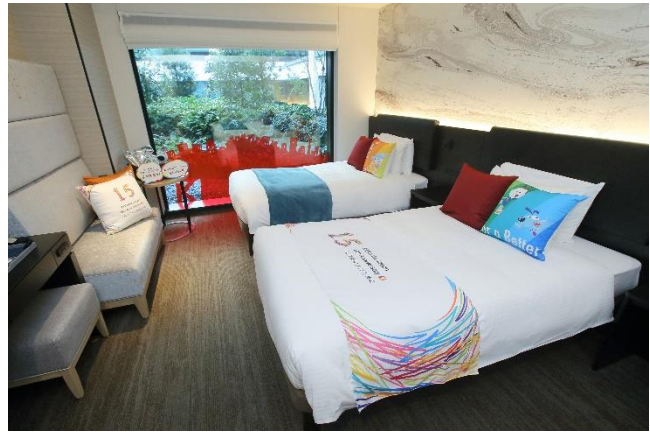
キッズニア東京コラボレーションルーム

フォトプロップス(手持ちの吹き出しパネル) パッチェぬいぐるみ・ナンバーバルーン