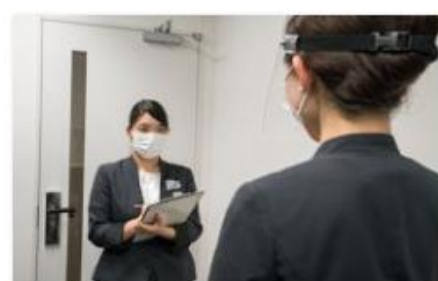
スタッフの体調管理の徹底