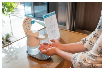
入館、館内施設利用時の検温と消毒