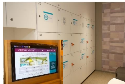
大浴場の利用制限と客室のテレビモニターで利用状況の確認