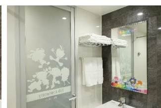
キッズニア 15th アニバーサリーコラボレーションルーム