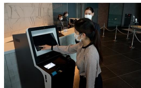
自動チェックイン機導入による接触軽減