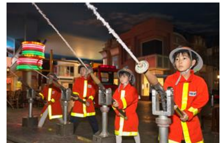
アクティビティ 一例

https://www.gardenhotels.co.jp/toyosu-baysidecross/plan/kidzania/