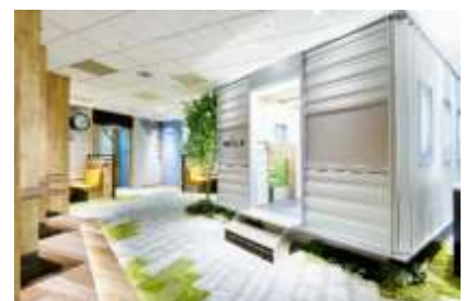
ワークスタイリング 汐留シティセンター