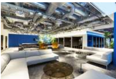
ワークスタイリング 八重洲