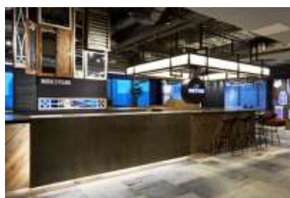
ワークスタイリング 東京ミッドタウン