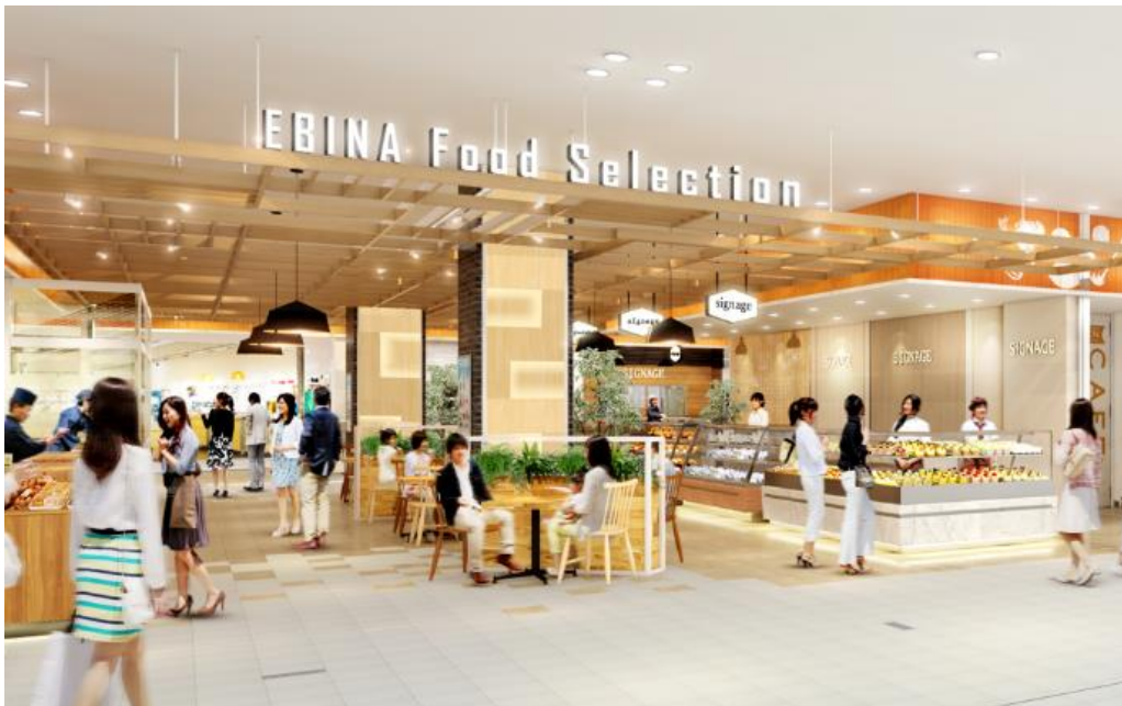
<EBINA FOOD SELECTION パース>

ららぽーと海老名は、本リニューアルを通じてお客さまの多様なニーズに応え、日常使いに適した店舗を拡充するほか、お客様が思い思いの時間を安心して楽しく過ごしていただける空間へと進化いたします。