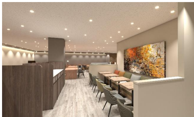
〈従業員休憩室② パース〉