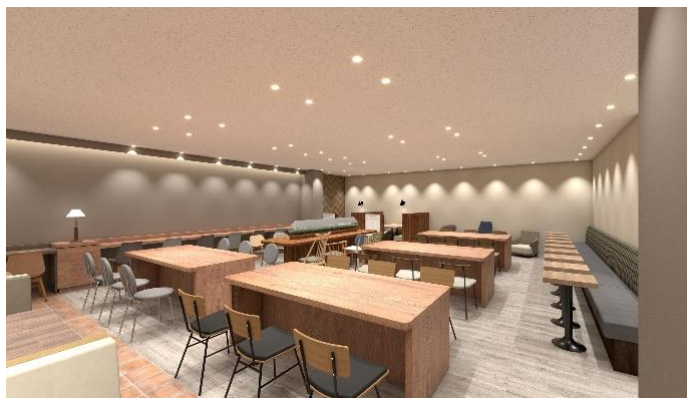
〈従業員休憩室① パース〉

ゆったりくつろげる休憩スペース、1人1人のパーソナルスペースが確保できるパウダーコーナー、ミーティングスペースなどを設置し、より快適な空間となりました。そのほか、携帯電話充電用コンセント、フリーWi-Fi、歯磨き用の洗面台、喫煙室、従業員用売店等、多様な要望に応える機能を備えています。