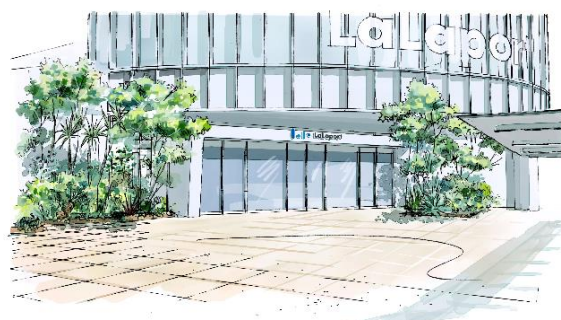
〈2階正面入り口 パース〉

フロアごとに異なる空間テーマのもと、館内各所に植栽・ファニチャーを整備することで、より快適により楽しくお買い物できる環境をご提供します。また、2階正面入り口には存在感のある植栽を多数配置することで、お買い物への楽しい雰囲気演出します。