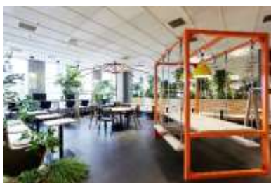
緑あふれる開放的な オープンスペース