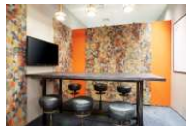
オープンな環境で 利用できる打合せスペース