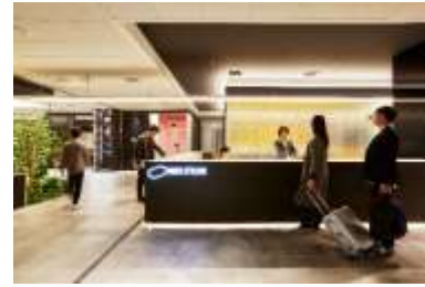
ビジネススタイリストが 「出会い」や「学び」の機会を提供