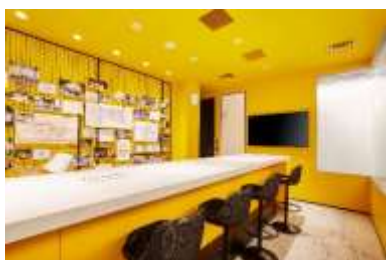
高揚感のある空間で アイデア実現に向けた議論を加速