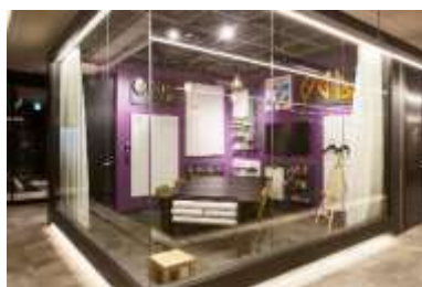
手を動かして思考を刺激し アウトプットを促進