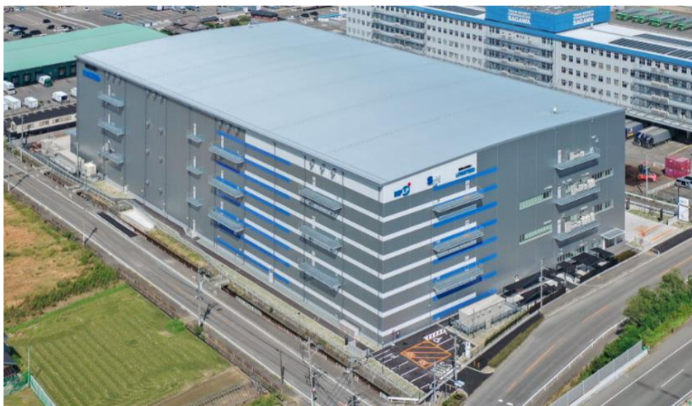
「MFLP・SGリアルティ福岡粕屋」建物外観

※BTS(Build To Suit):特定のテナントのニーズに応じてオーダーメイドで建設し、賃貸すること