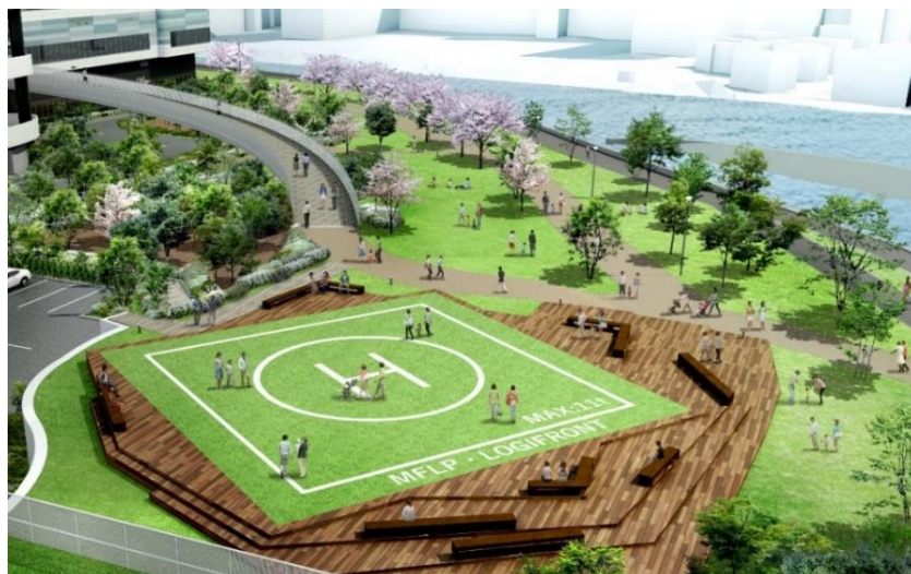
「板橋区立・舟渡水辺公園」との一体整備イメージ

なお、今後「板橋区立・舟渡水辺公園」と一体となった約 3 万㎡の公開空地、新河岸川沿いの歩行空間につきましては、地域の皆さまにも開放することを計画しています。