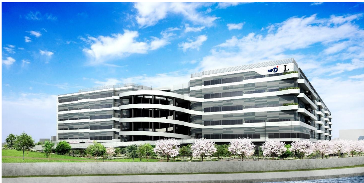
「MFLP・LOGIFRONT 東京板橋」完成予想イメージ

本施設は、日鉄興和不動産が 2021 年 6 月 30 日に従前地である日本製鉄株式会社の工場跡地を取得後、板橋区の地域の防災力向上に資するべく行政協議を重ねてまいりました。三井不動産が参画し、各社の実績、ノウハウを最大限に活用しながら、2024 年 9 月(予定)の竣工に向けて本プロジェクトを推進してまいります。