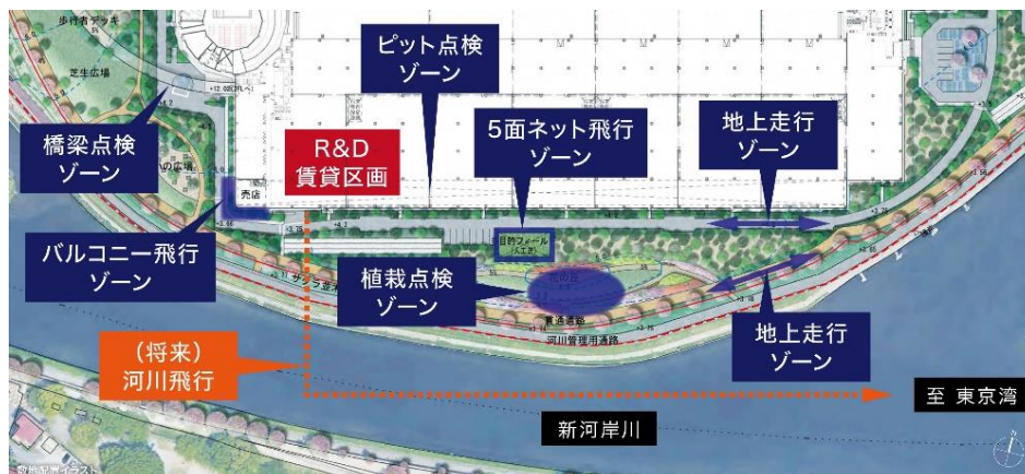
賃貸用 R&D 区画イメージ

※2 2022 年 12 月 5 日に改正航空法が施行。機体認証、無人航空機操縦者技能証明、運航ルールの新制度が整備された。