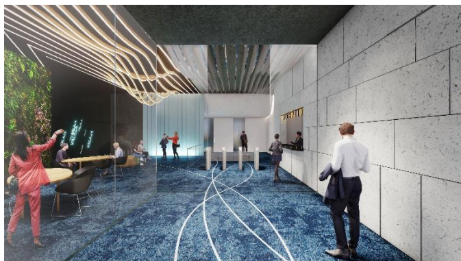
メインエントランスイメージ

また、礼拝所やジェンダーレストイレを設置することでダイバーシティ&インクルージョン(D&I)を推進するとともに、従業員の働きがい向上に資するべく、売店・カフェテリアスペース、ラウンジ、デッキテラス等、共用部の更なる充実を図ります。新型コロナウイルス感染症対策としては、タッチレスエレベーター等の最新技術も導入するなど、従業員の皆さまにより快適で安全な環境を提供します。