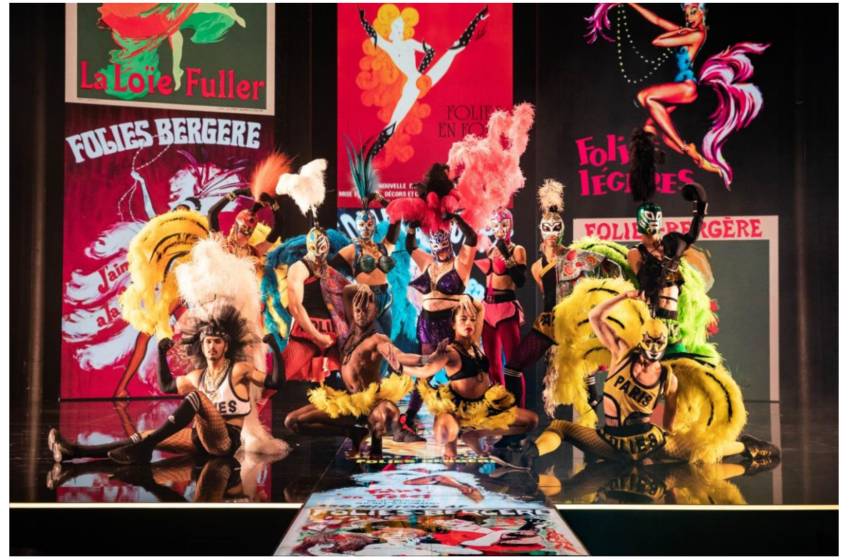
「ファッション・フリーク・ショー」舞台イメージ