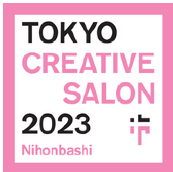
東京クリエイティブサロン日本橋2023 キービジュアル

東京クリエイティブサロン日本橋2023実行委員会と三井不動産株式会社は、国内最大級のファッションとデザインの祭典「東京クリエイティブサロン2023」の枠組みのなかで、「東京クリエイティブサロン日本橋2023」を3月17日(金)から3月31日(金)までの15日間、日本橋エリアで開催いたします。