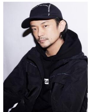
眞鍋大度 (アーティスト、 プログラマー、DJ)