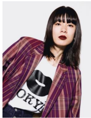
とんだ林蘭 (アーティスト)