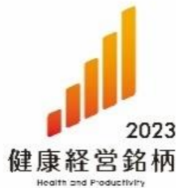
健康経営銘柄 ロゴマーク

当社グループでは、新しい価値を創造し続けるための原動力は人材という資産であると考えており、ダイバーシティ&インクルージョンの推進を重要な経営戦略の一つと位置付け、多様な価値観・才能・ライフスタイルを持った人材が、それぞれの持てる力を最大限に発揮するための組織づくりをグループ一体となって進めています。当社グループは、今後も社員の健康保持・増進や社外のビジネスパートナーへの健康経営の普及・拡大等の各種取り組みを推進することで、社会課題の解決に貢献してまいります。