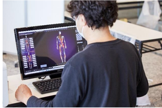
出張測定会の様子

また、アプリでの施策においては、オンラインで参加出来るウォーキングイベント「&well Walk」を計 3 回実施。約 30 社の参加企業から延べ 15,000 人程がそれぞれチームを組み、期間中に平均歩数を競うことで、社内コミュニケーションの活性化と歩くことから健康へのきっかけを提供するといった取組も進めております。