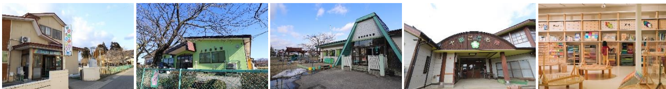
▲ 写真左から：民田保育園、上郷保育園、湯田川保育園、十坂こども園、キッズドームソライ