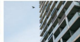
東京都豊島区 PARK AXIS 池袋