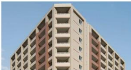
北海道札幌市 PARK AXIS 札幌植物園前