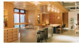
東京都墨田区 PARK AXIS 錦糸町スタイル