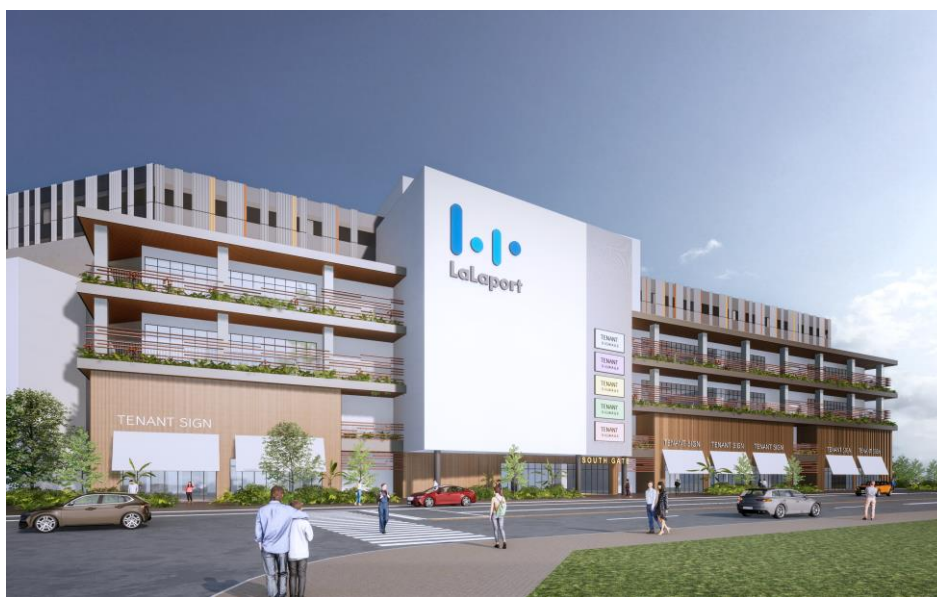
「(仮称)三井ショッピングパーク ららぽーと高雄」外観イメージ

なお、当施設は、鳳山エリア周辺の自然・文化・アートと調和を図った外装デザインを採用。約43,000㎡の広大な敷地に低層のモール構成とすることで、お客さまが快適に回遊・滞在できる施設となります。