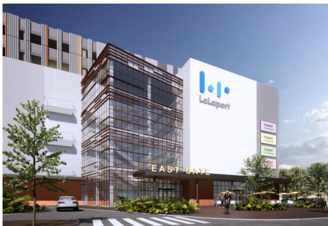
東側入口 外観イメージ

当施設は、「New Nexus of Kaohsiung」をコンセプトに、自然・文化・アートが溢れる高雄市東部に不足していたショッピング機能を提供。新たに人や物のつながりを生み出し、高雄市の商業の中心地となります。店舗数は約 280 店を予定し、台湾内外のファッションブランドに加え、日系店舗を含む高雄市初進出店やご当地グルメなどで構成されるフードコートをはじめとした飲食店や、スーパーマーケットなどデイリーニーズの高い店舗等で構成されます。さらにサービスやエンターテインメント機能を充実させることで、高雄市の消費者ニーズに総合的に応える時間消費型商業施設を実現します。