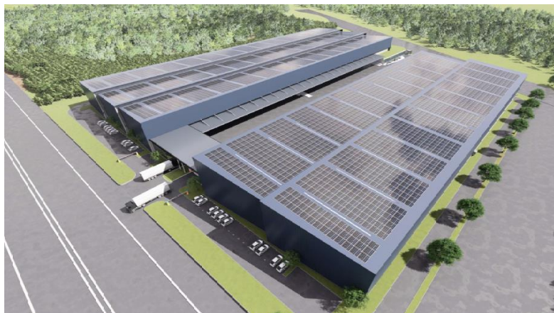
「クリムロジスティクスハブ」外観 CG 奥:第 1 期 手前:第 2 期

三井不動産株式会社(所在:東京都中央区、代表取締役社長 植田 俊)は、「MITSUI FUDOSAN (ASIA) MALAYSIA SDN. BHD.」(マレーシア三井不動産、所在地:クアラルンプール)を通じて、現地大手物流会社 PKT LOGISTICS GROUP SDN. BHD.(ピーケーティロジスティクスグループ社、以下「PKT 社」と)と共同事業契約書を締結し、マレーシア・ケダ州クリムにおける物流施設事業「クリムロジスティクスハブ」(延床面積約 36,000 m 2 (うち第 1 期約 22,000 m 2 、第 2 期約 14,000 m 2 (予定))への参画を決定したことをお知らせします。なお、本事業は PKT 社とマレーシア三井不動産との合弁会社「KULIM LOGISTICS HUB SDN. BHD. (クリムロジスティクスハブ)」を通じて推進します。本事業は、当社グループ初のマレーシアにおける物流施設事業です。