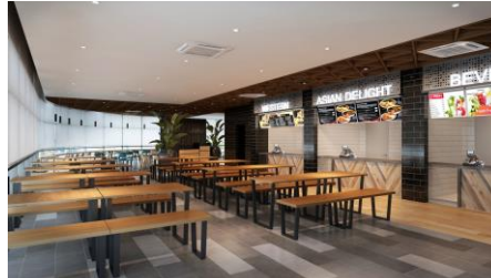
カフェテリア完成予想CG（第1期）