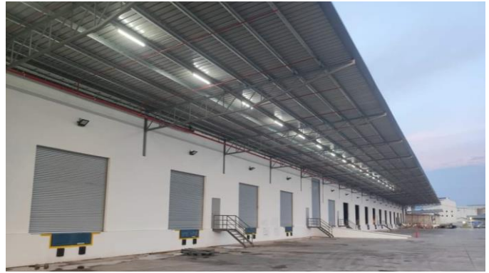
トラックバース（第1期）