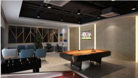
ドライバー休憩室完成予想CG（第1期）