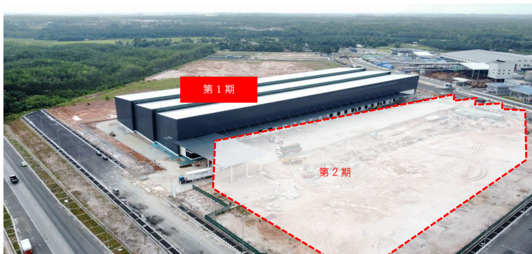
「クリムロジスティクスハブ」外観