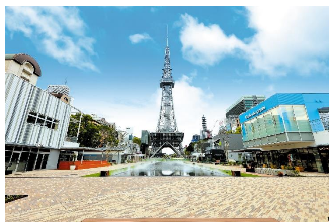
RAYARD Hisaya-odori Park