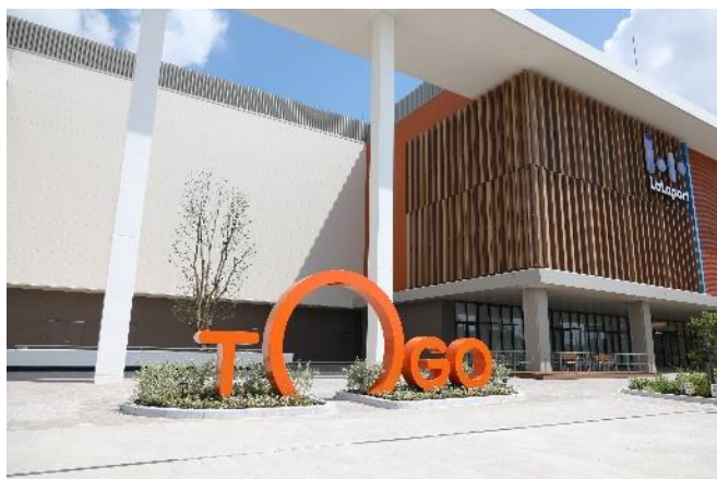
三井ショッピングパーク ららぽーと愛知東郷

また、(仮称)ららぽーと安城の着工を記念して、2023 年 10 月 28 日(土)から 11 月 12 日(日)の期間、ららぽーと名古屋みなとアクルス、ららぽーと愛知東郷、三井アウトレットパーク ジャズドリーム長島の 3 施設にて(仮称)ららぽーと安城 着工記念イベントやキャンペーンを実施いたします。詳細は後日公開の施設 HP 等をご確認ください。