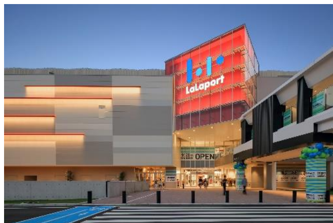
三井ショッピングパーク ららぽーと名古屋みなとアクルス