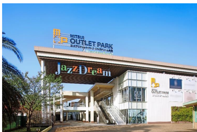
三井アウトレットパーク ジャズドリーム長島