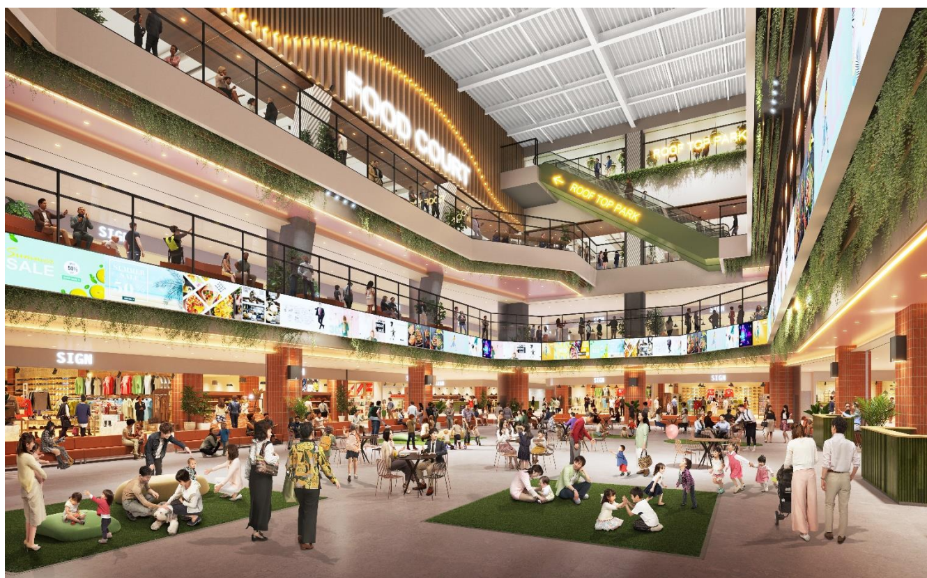
「(仮称)三井ショッピングパーク ららぽーと安城」内観 CG

太陽光パネルの設置や効率的なエネルギー運転管理、省エネアイテムの導入等により、CO 2 排出量の削減をはじめとした ESG 課題の解決に取り組んでまいります。