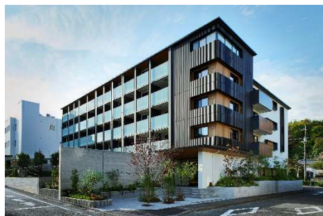
木造マンション「MOCXION(モクシオン)」

なお、伐採適期を迎えて計画的に伐採した木材、森のメンテナンスのために間伐した木材は、木造賃貸ビルや木造住宅などの主要部材、各施設の仕上材のほか、住宅のフローリング材の下地やオフィス家具、商業施設共用スペースのベンチや遊具として使用するなど、グループ企業で幅広く、積極的に活用しています。