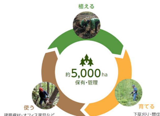
“終わらない森”創りのサイクル