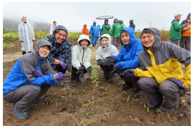
オリンピックとともに植林研修活動を実施した様子