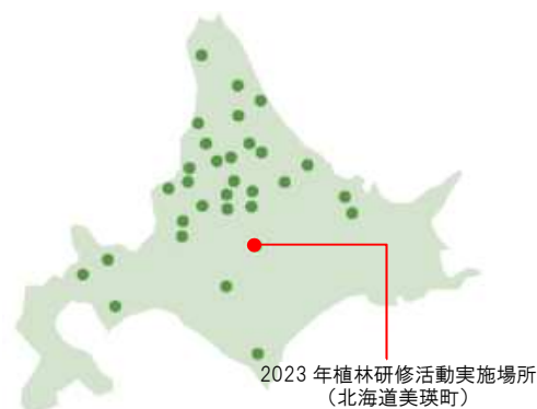
グループ保有林のエリア

※SGEC 認証とは:「『緑の循環』認証会議(SGEC)」により、「森林が持続可能な方法で適切に管理されていること」を評価・認証する制度