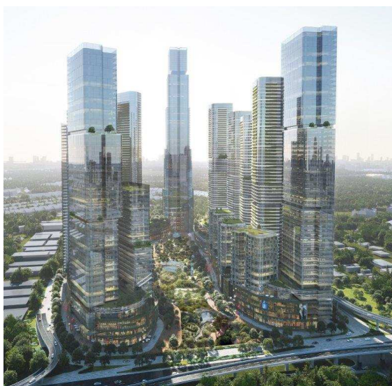
Setia Federal Hill 全体パース

※ GreenRe とは、マレーシアにおける環境性能認証で、エネルギー効率、水資源、環境保護、室内環境、緑化、CO2 削減の 6 項目の環境性能評価により、建築物を格付けします。