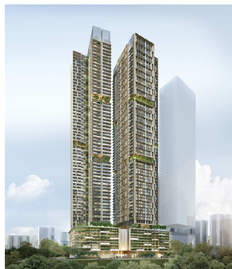
タワー1、タワー2 パース