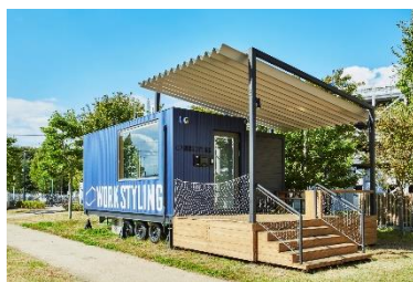
ワークスタイリング SOLO (ワークスタイリング SOLO 柏の葉)