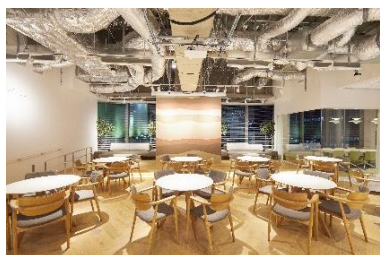
ワークスタイリング SHARE (ワークスタイリング 東京ミッドタウン八重洲)

「ワークスタイリング FLEX」：1席からハイグレードビルにオフィスを持てるレンタルオフィス