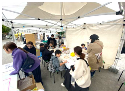
【2023 年 11 月に開催した化粧品回収&ワークショップの様子】

スキンケア商品、リキッドやクッションファンデーション、クリームタイプのファンデーション、リップグロス、ティント系リップ、透明リップ、透明口紅、マスカラ等