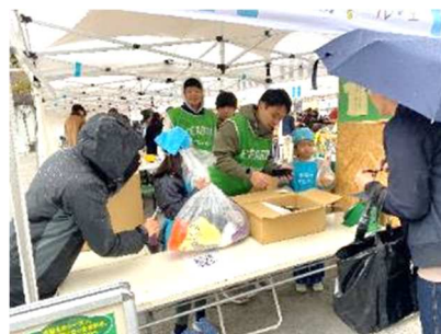
【2023 年 11 月の&EARTH 衣料回収プロジェクトの様子】