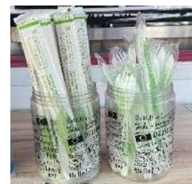
【環境に配慮したカトラリー】