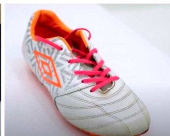
【「おさがり循環プロジェクト」イメージ図】