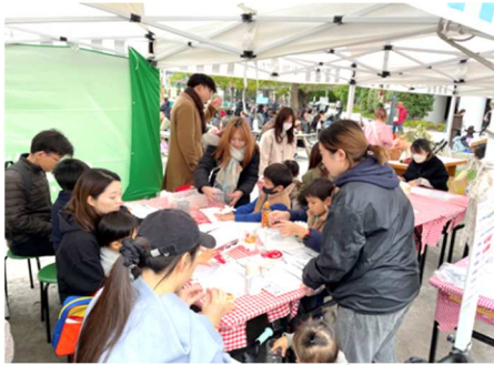
【2023 年 11 月「&EARTH 教室」の様子】

※前回 2023 年 11 月開催時は、計 76 名のお子様にご参加いただきました。