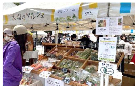
【これまでの「太陽のマルシェ」の様子】