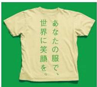
【&EARTH 教室衣料回収プロジェクト】イメージ