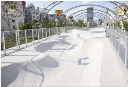
MIYASHITA PARK (東京都渋谷区)

三井不動産は、2016年から「BE THE CHANGE」というスローガンを掲げ、スポーツの要素を盛り込んださまざまな街づくりを手掛けてまいりました。ボルダリングウォールやスケート場などを備えた「MIYASHITA PARK」、200m陸上トラックなどを含むスポーツパークを有する「三井ショッピングパーク ららぽーと福岡」、本格的なスポーツ・エンターテインメントイベントが実施可能な屋内型スタジアムコート有する「三井ショッピングパーク ららぽーと堺」などの『場』を整えるとともに、子どもたちがアスリートの1DAYのレッスンを受けられる「三井不動産スポーツアカデミー」などのイベント実施をはじめとした『コミュニティ』づくりを進めており、その取り組みを加速しています。また、2024年春には収容人数1万人規模の大型多目的アリーナ施設「LaLa arena TOKYO-BAY」(株式会社MIXIとの共同事業)の開業も控えており、今後も「スポーツの力」を活用した街づくりを推進してまいります。