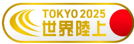
世界陸上 2025 東京 (2025 年 9 月放送)

TBS は放送にとどまらず、様々なコンテンツで「ときめくときを。」届けてまいりました。また、2021 年に公表した「VISION2030」では様々なフィールドで「最高の“時”で、明日の世界をつくる。」というブランドプロミスを掲げております。TBS スポーツコンテンツではこれまで、2021 年の『マスターズ』で松山英樹選手の日本人男子初となる海外メジャー制覇、27 年の歴史を誇る『SASUKE』で熱い挑戦者たちの姿、そして昨年『世界陸上 2023 ブダペスト』で女子やり投げの北口榛花選手の女子フィールド種目初となる金メダル獲得などをお届けし、「スポーツのチカラ」を感じた方もいるかもしれません。そしてこれからは、2025 年の 9 月に四半世紀ぶりの開催となる『世界陸上 2025 東京』の放送も予定しているほか、2028 年のロス五輪では近代五種のひとつとして『SASUKE』を基に考案された障害物レースが採用されるなど、TBS が手がけてきたスポーツの魅力をより身近に感じる日が待っています。「VISION2030」では、生み出すコンテンツは放送だけにとどまりません。年齢、性別、スポーツ経験の有無に関わらず楽しめるボーダレスなピククルボールを新しいスポーツエンターテインメントとして展開していきます。