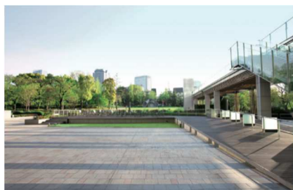
東京ミッドタウン コートヤード