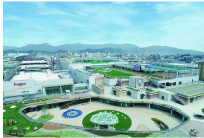
三井ショッピングパーク ららぽーと福岡 (福岡県福岡市)