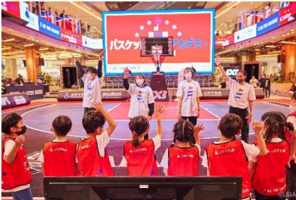
三井不動産スポーツアカデミー (バスケットボールアカデミー)