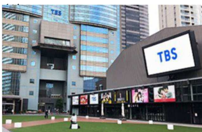
TBS 放送センター前 赤坂サカス広場

[特設サイト] https://pickleballpark.jp/nihonbashi/