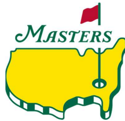
マスターズ (毎年 4 月放送)