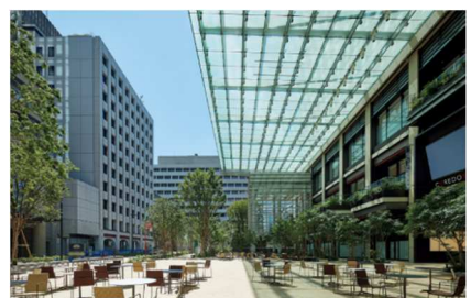
COREDO 室町テラス 大屋根広場