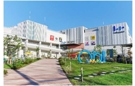
三井ショッピングパーク ららぽーと堺 (大阪府堺市)