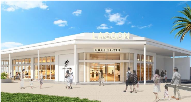
「LAGOON TOOTH TOOTH」CG

毎日がハレの日のように輝いたライフスタイルを提案する“ハレノニチジョウ”をブランドコンセプトに、店内製造の焼き立てベーカリー、自家製麺の生パスタなどのお食事を楽しめるレストランとともに、地元神戸で愛され続けてきた PATISSERIE TOOTH TOOTH のケーキや焼き菓子など、神戸土産におすすめの商品が並ぶ物販店を併設します。