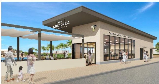
「喫茶 太陽コンパス」CG

異国情緒あふれる神戸ならではのどこか懐かしさを感じさせる喫茶文化をモダンに表現した新業態のカフェ。オリジナルブレンドにこだわったサイフォン珈琲や紅茶などのドリンクを中心に、神戸らしい洋食メニュー、名物カステラなど自慢のデザートをお届けします。大人から子どもまでオールデイに使えるパブリックな喫茶店です。