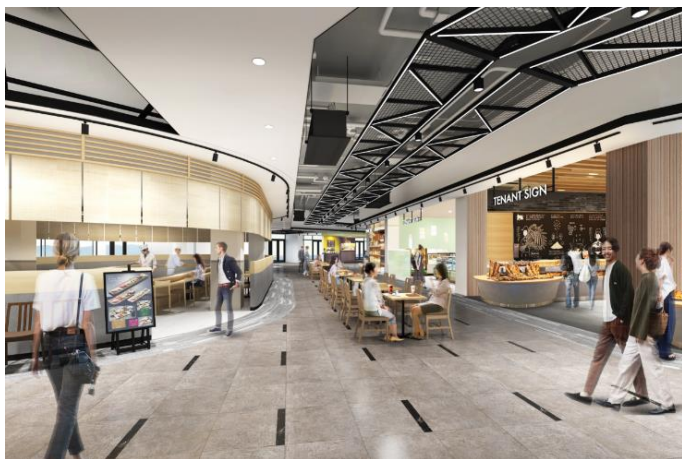
三井アウトレットパーク マリンピア神戸 1 階フードマルシェ CG

また、1 階はイートイン・テイクアウト等様々なシチュエーションで利用可能なフードマルシェ、2 階には明石海峡大橋を望む開放的なフードコートが新たに誕生し、リゾートのようなゆったりとした雰囲気の中でお食事をお楽しみいただけます。