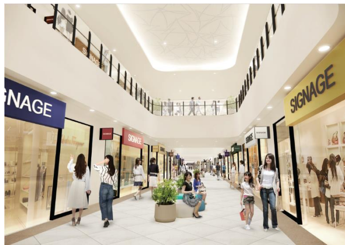
三井アウトレットパーク マリンピア神戸 内観 CG

また、1 階はイートイン・テイクアウト等様々なシチュエーションで利用可能なフードマルシェ、2 階には明石海峡大橋を望む開放的なフードコートが新たに誕生し、リゾートのようなゆったりとした雰囲気の中でお食事をお楽しみいただけます。