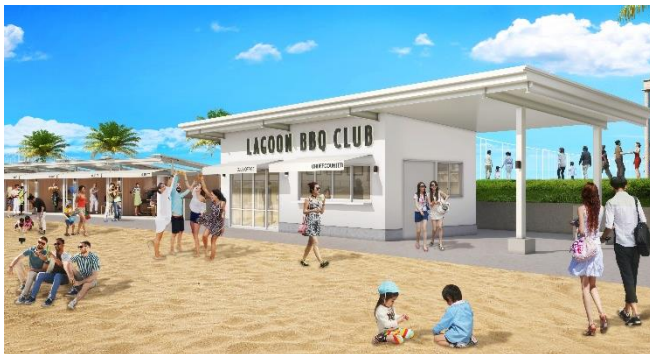
「LAGOON BBQ CLUB」CG

ラグーンビーチを見渡す絶景のロケーションに、約 200 席の大型 BBQ 場が誕生します。TOOTH TOOTH からお届けする神戸近郊の美味しい素材を活かした BBQ プランなど、ラグジュアリーに BBQ を楽しむもよし、食材やドリンクを持ち込んでカジュアルに BBQ を楽しむもよし。さまざまなシーンで使える、上質な都市型リゾート BBQ パークです。