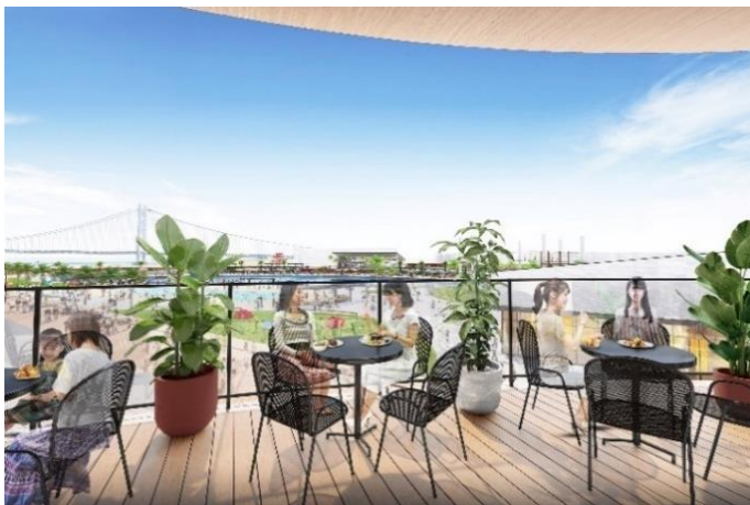
三井アウトレットパーク マリンピア神戸 2 階フードコート テラス席 CG