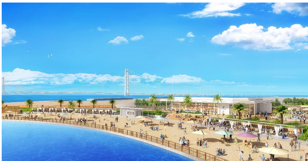
三井アウトレットパーク マリンピア神戸 ラグーンエリア CG

先行発表以外の店舗および各店舗の詳細につきましては、2024年9月頃に発表予定です。