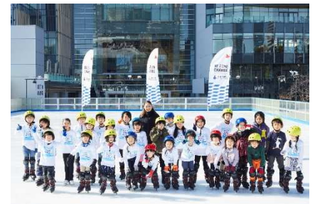
三井不動産スポーツアカデミー (アイススケートアカデミー)