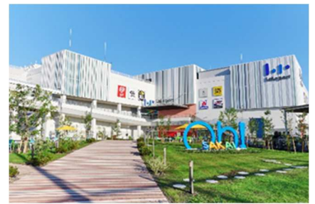
三井ショッピングパーク ららぽーと堺 (大阪府堺市)