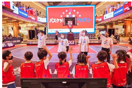
三井不動産スポーツアカデミー (バスケットボールアカデミー)