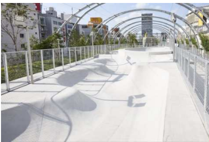
MIYASHITA PARK (東京都渋谷区)

2024年5月29日には収容人数1万人規模の大型多目的アリーナ施設「LaLa arena TOKYO-BAY」(株式会社MIXIとの共同事業)の開業も控えており、今後も「スポーツの力」を活用した街づくりを推進してまいります。