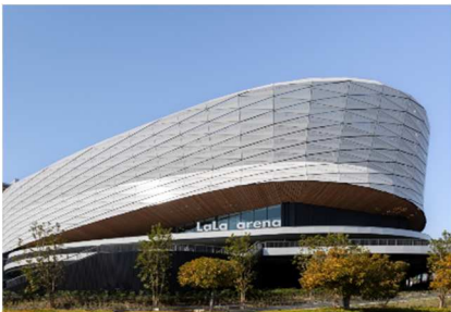
LaLa arena TOKYO-BAY (千葉県船橋市)