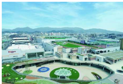
三井ショッピングパーク ららぽーと福岡 (福岡県福岡市)