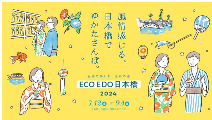
ECO EDO 日本橋 2024 キービジュアル

協 賛：COREDO日本橋、COREDO室町1～3・テラス、高島屋新館、東京建物株式会社、東レ株式会社、日本橋高島屋S.C.、日本橋三井タワー、日本橋三越本店、マンダリン オリエンタル 東京、三井本館、三井ガーデンホテル日本橋プレミア、YUITO/YUITO ANNEX(野村不動産株式会社) 他