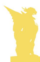
隠れ麒麟のシルエット イメージ