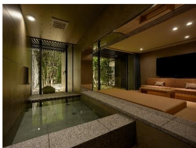
プライベートバス