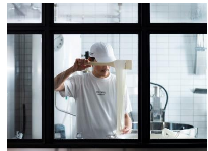
フレッシュチーズラボラトリー