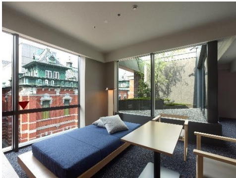
ジュニアスイート