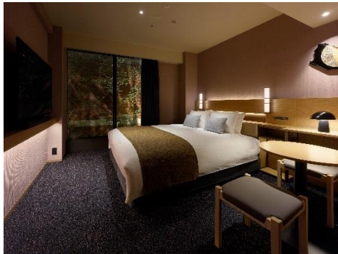
スーペリアクイーン