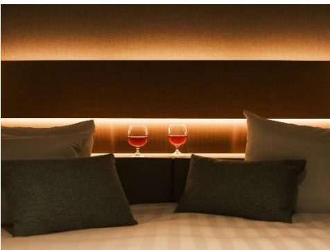
客室ヘッドボード