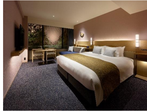
スーペリアキング(デイベッド)