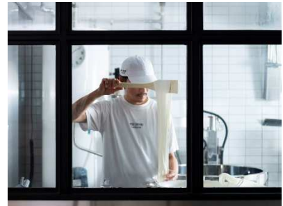
フレッシュチーズラボラトリー