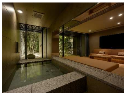
プライベートバス