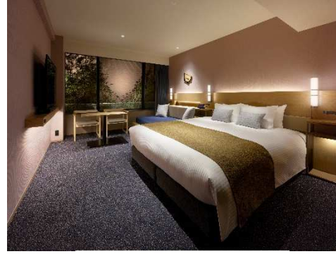
スーペリアキング(デイベッド)