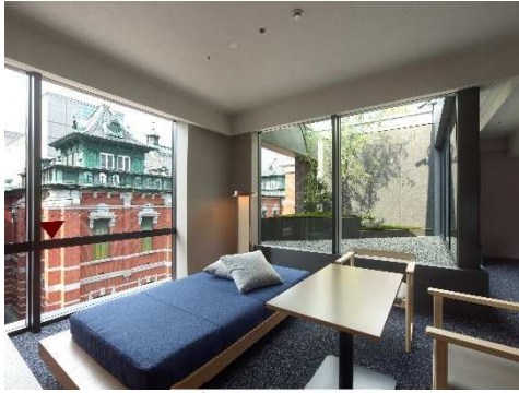
ジュニアスイート