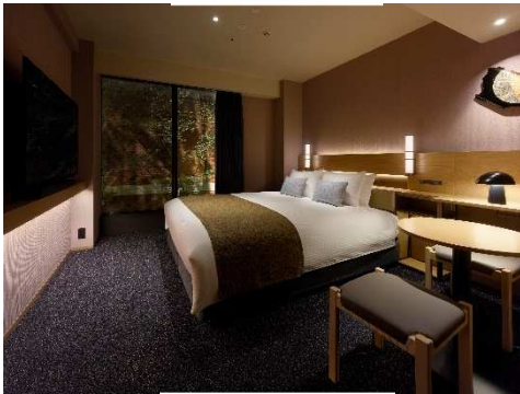
スーペリアクイーン