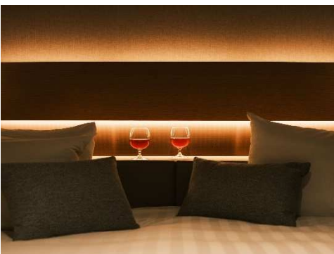
客室ヘッドボード