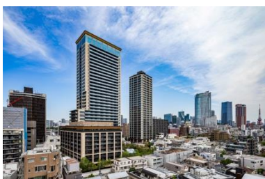
パークウェルステイト西麻布

2024 年秋に一挙 3 物件の開業を予定しています。シリーズ最高峰 ※5 のフラッグシップ物件となる「パークウェルステイト西麻布（東京都港区）」は、ブランドシリーズ内で初となる都心立地物件です。都心でありながらも美しい水景や豊富な自然が広がるこだわりの外構に加えて、帝国ホテルが提供するレストラン等、おもてなしを尽くしたサービスと設備を備えています。また、「パークウェルステイト幕張ベイパーク（千葉県千葉市美浜区）」は都心から 30 分の交通利便性と、ショッピング施設・スタジアム・ホテル等多彩な商業施設が揃い、海や広大な公園が至近と恵まれた生活環境を享受できるパークウェルステイトシリーズ史上最大規模のレジデンスとなります。さらに神奈川県初となる「パークウェルステイト湘南藤沢 SST」は「湘南コミュニティ Life」のコンセプトのもと、湘南らしさを随所に取り入れ、人と人とのつながりを感じられる場と機会の創出を意識した作りになっており、生き生きとした暮らしをお楽しみいただけるレジデンスとなっております。