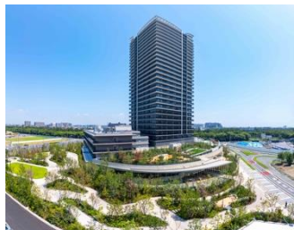
パークウェルステイト幕張ベイパーク