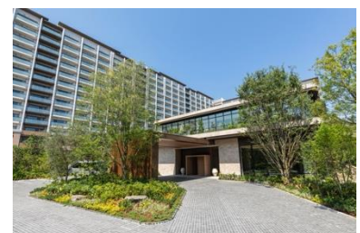
パークウェルステイト湘南藤沢 SST