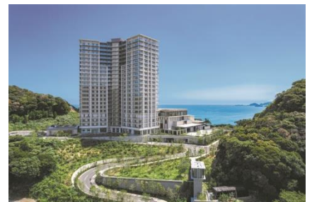
本 TVCM 撮影地「パークウェルステイト鴨川」